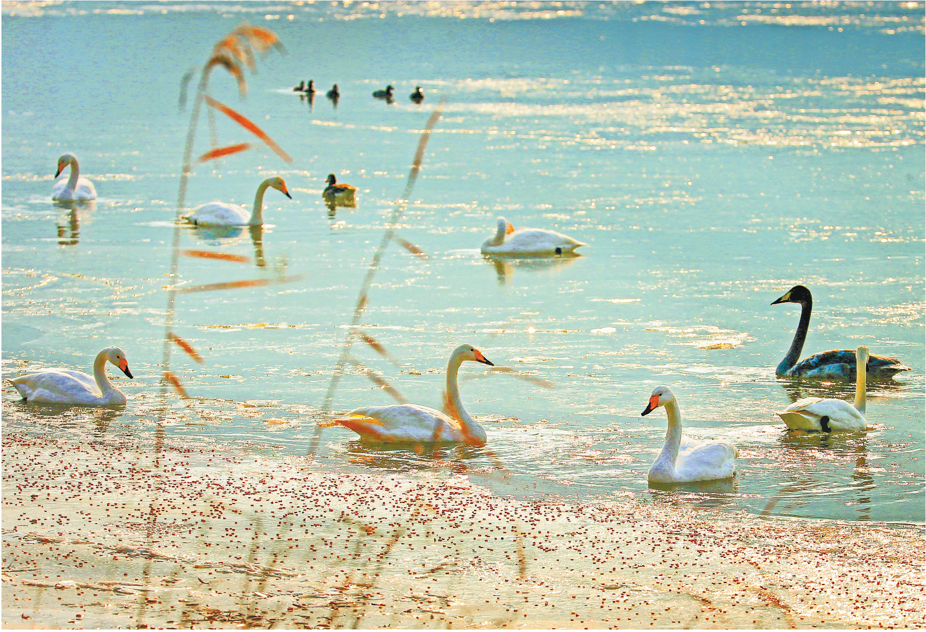
兰州市西固区三江口天鹅滩白天鹅在觅食。