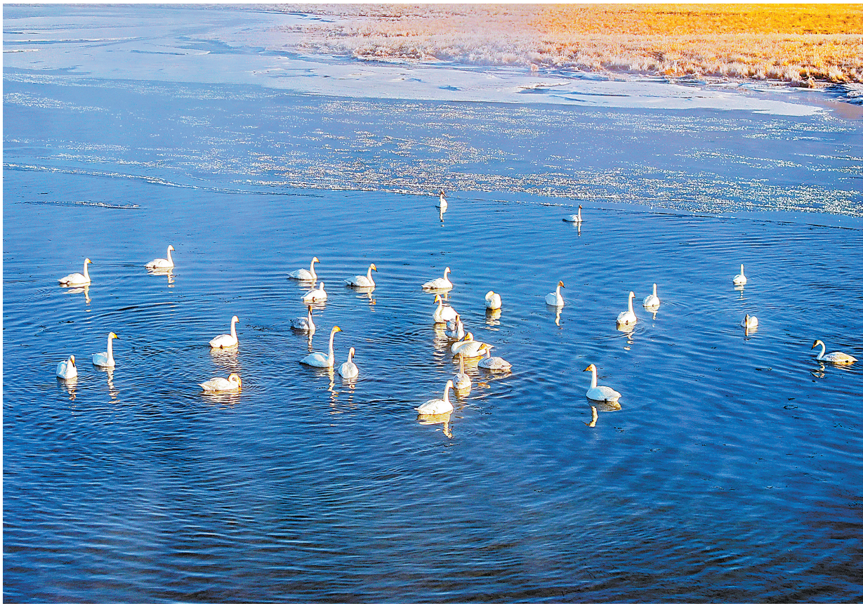
甘南州碌曲县尕海则岔国家级自然保护区成群的天鹅优雅游弋。