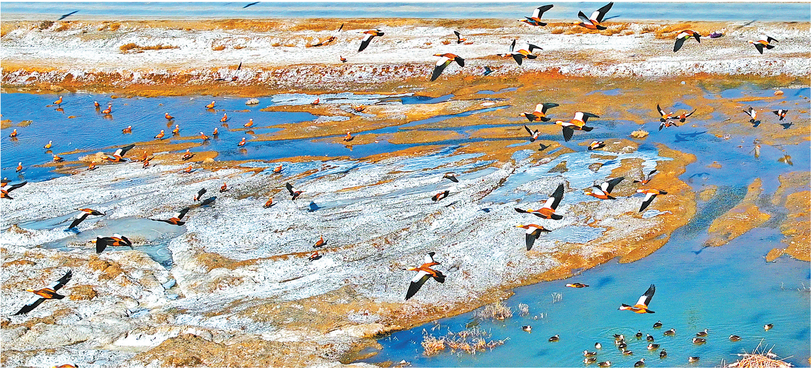
白银市景泰县滩涂湿地候鸟翔集。