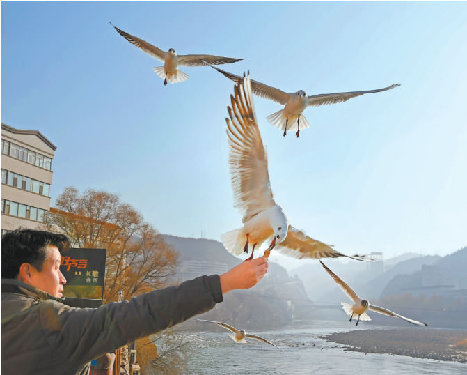
临夏州永靖县刘家峡镇黄河边,游人与红嘴鸥亲密互动。