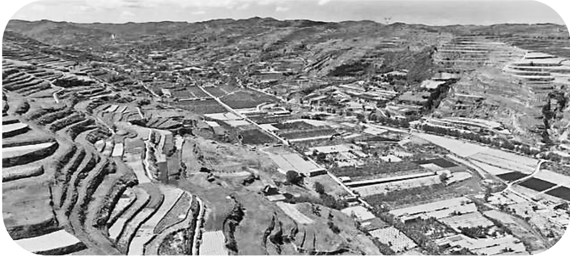
街亭位于秦安县城东北40公里的陇城镇,是一处宽约6公里、长达十几公里的开阔地带,是历代兵家必争之地。三国时期魏蜀街亭之战就发生在这里。街亭河谷开阔,四通八达,南北山势险要,进攻能够攻,退可以守。

从《三国志》的记载和实地考察来看,笔者认为古战场的作战位置就在今秦安县陇城镇东四公里的百顷塬地带。