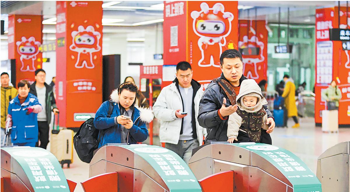
2月4日,春节长假最后一天,兰州西站迎来返程客流高峰。