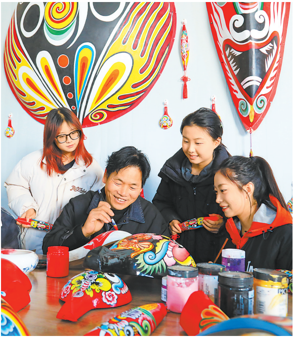
△ 春节假期,徽县银杏镇马山村非遗工坊、省级非遗项目马勺脸谱传承人和返乡大学生创作春节社火脸谱。

甘肃省疾病预防控制中心专家提醒,要密切关注自己的健康状况,出现发热和急性呼吸道感染等异常症状,不要带病参加聚会,根据情况采取居家休息、服药或及时就医等措施;若病情加重时,应立即就医。到医院就诊时,做好自我防护。注意戴口罩,回家后要认真洗手。