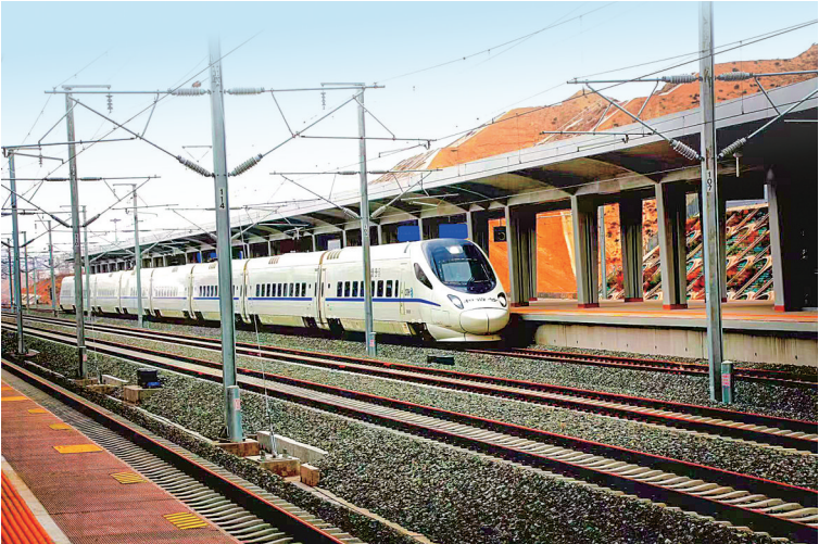
步入高铁时代的白银区位优势更加凸显。