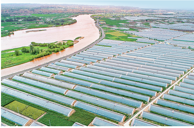
靖远县万亩设施蔬菜基地。