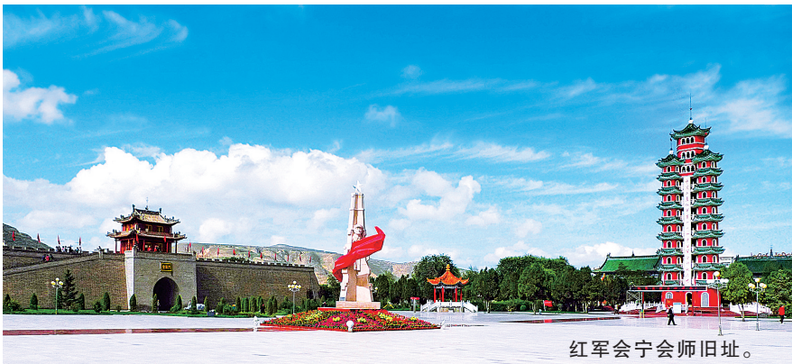
红军会宁会师旧址。

祖厉河的治理,正在将治理一条河改变一座城、繁荣一座城的美好夙愿变成现实。这也是白银市全力打造黄河生