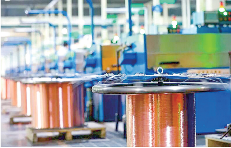
白银有色集团西北铜加工有限公司生产的新型铜材产品。