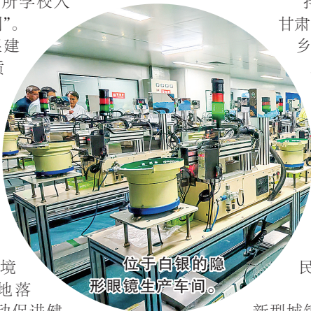
位于白银的隐形眼镜生产车间。

深入实施以人为本的新型城镇化战略,扎实推进强县区域行动。白银区蝉联全省“十强县”,