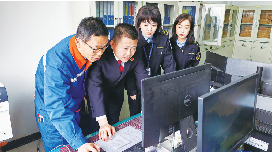
2024年3月26日,嘉峪关市人民检察院干警走访嘉峪关祁连山水泥有限公司,立足法律监督职能实地查看企业安全生产文化建设台账资料、网上系统平台以及工人作业现场,结合“八号检察建议”现场普法,压实企业安全生产主体责任。

针对发现的问题,该院依法向相关行政管理部门制发了检察建议,建议完善辖区寄递行业日常监管,加强相关部门之间的协作配合,防范各类危害寄递安全的事件发生。收到检察建议后,相关行政管理部门高度重视,采取多项措施规范辖区寄递物流管理,落实各项安全防范措施。