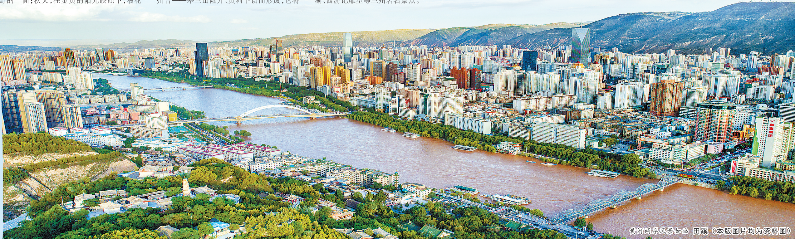
黄河两岸风景如画 田璞(本版图片均为资料图)

到兰州黄河风情线游览,白马浪一定不容错过。这段千余米的地方,有黄河铁桥、甘肃科举博物馆、白云观、白塔山、水车园、小西湖、西游记雕塑等兰州著名景点。