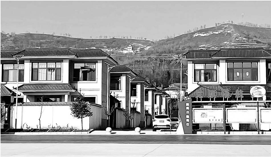
和政县三合镇集中安置点居民小楼。

和照顾家庭两不误。同时，安置点积极组织有意愿的238名搬迁群众赴厦门、新疆等地务工，还为无法外出务工的5户零就业家庭每户落实了1名公益性岗位，确保搬迁群众“搬得出、稳得住、有就业、生活好”。