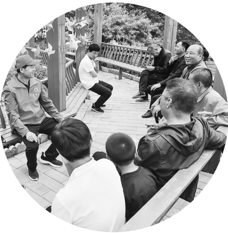
武沟乡武沟村村民在议事。

如今，“村庄美、产业兴、治理好、乡风和、百姓富、集体强”的和美乡村画卷，正在镇原县这片热土上徐徐铺展。