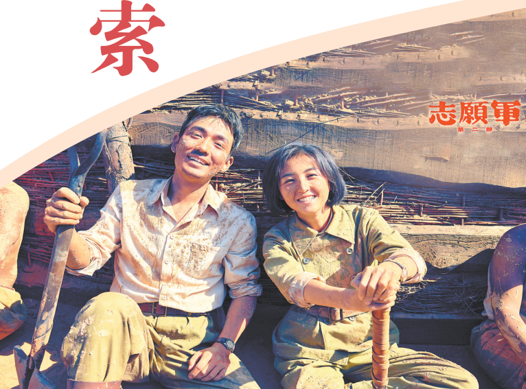
《志愿军:存亡之战》海报