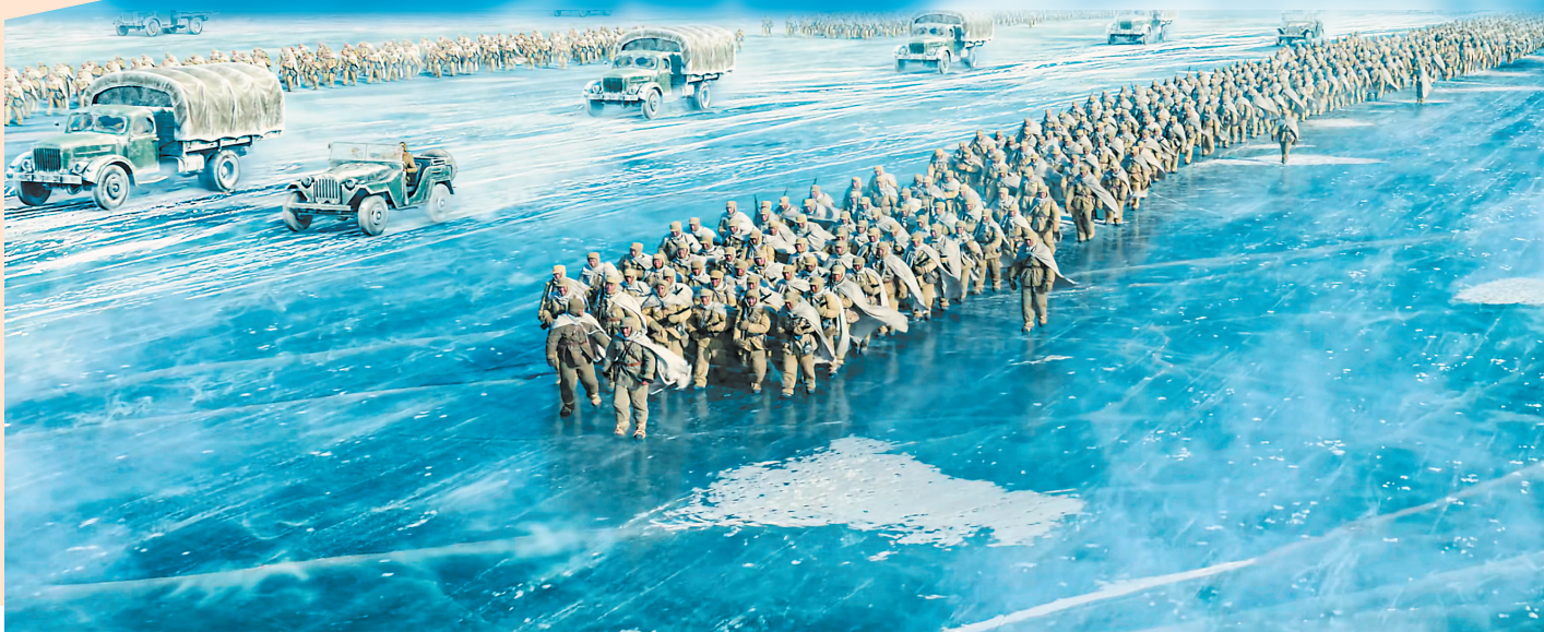
《志愿军:存亡之战》剧照