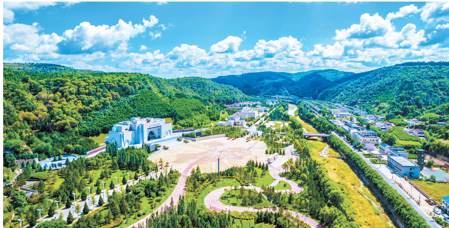
“国家级生态乡镇”——华池县南梁镇。