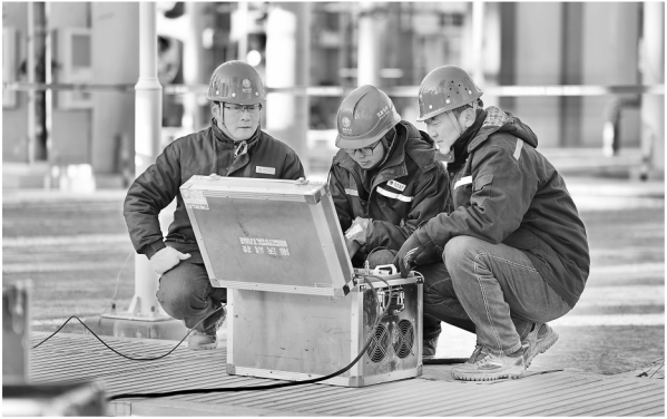
庆阳750千伏变电站工程

崆峒区通过聚力实施“增量扩繁、加工增效、交易营销、种群培育、饲草供给、品牌打造、循环发展”七大工程，做强产业链、打造循环链、融通供应链、提升价值链，不断增强平凉红牛产业质量效益和整体竞争力，推动平凉红牛产业高质量发展。