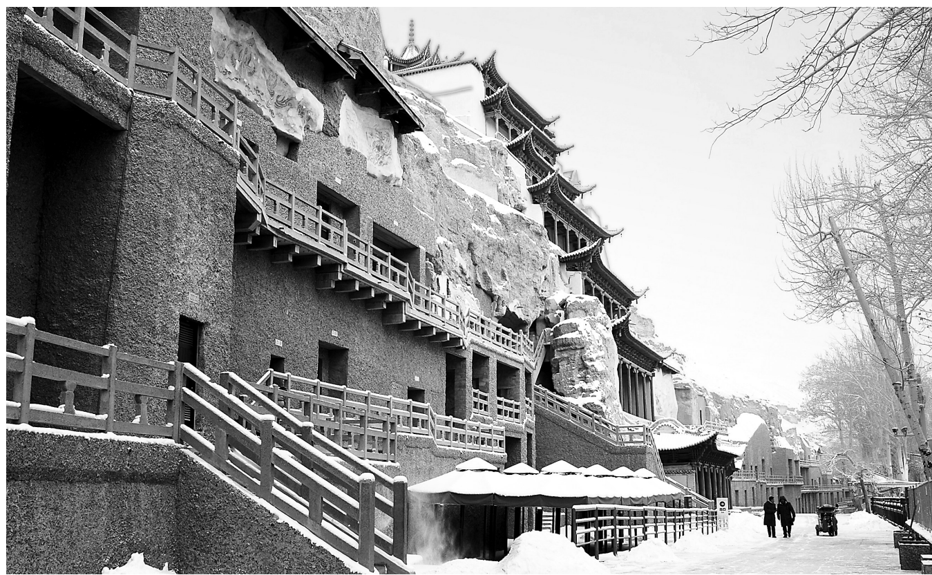
雪映莫高窟 资料图