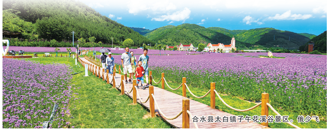
合水县太白镇子午花溪谷景区。俄少飞

公立医院改革与高质量发展示范项目基本完成,建成3个国家级、38个省级、76个市级临床重点专科和中医特色优势专科。投资12.99亿元的陇东区域医疗中心建成投用。新增公办幼儿园学位1710个,义务教育学位8890个、高中学位5450个,镇原县教师“县管校聘”入选2023年全国基础教育改革典型案例。长征国家文化公园环县山城堡战役旧址综合保护利用项目竣工验收,长城国家文化公园(华池段)项目加快建设。南佐遗址保护利用项目纳入国家储备清单。