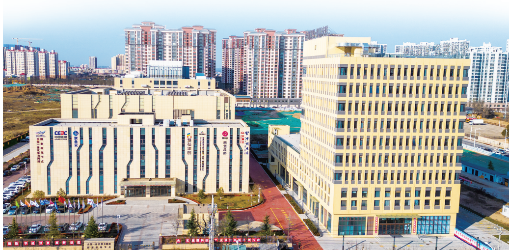
国家数据中心集群(甘肃·庆阳)“东数西算”产业园资源调度区。陈飞

头部企业加速集聚。对接98家央企布局数字经济,落地15家。一大批大模型企业、芯片企业、人工智能生态企业汇聚庆阳,智谱清言等国内大模型训练推理需求及智能驾驶、视频渲染等行业应用场景成功落地,和北上广深等地形成前店后厂模式。与首都在线联合打造国内规模最大、品类最全、技术最先进的异构算力适配中心,