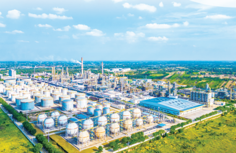
中国石油庆阳石化公司厂区。陈飞

刚刚过去的2024年,是庆阳市高质量发展的关键一年。庆阳市认真贯彻落实党中央、国务院决策部署和省委、省政府工作要求,聚焦“挑大梁、作标杆”总要求,紧盯“五地”总目标,实施“双轮驱动”,坚持“三化并进”,强化“四建支撑”,坚定不移抓改革、促转型,兴产业、扩投资,保底线、惠民生,全市经济社会发展呈现稳中有进、量提质升、蓄能向新的良好态势。预计全年地区生产总值将达1250亿元。发展的背后,写满了奋斗。