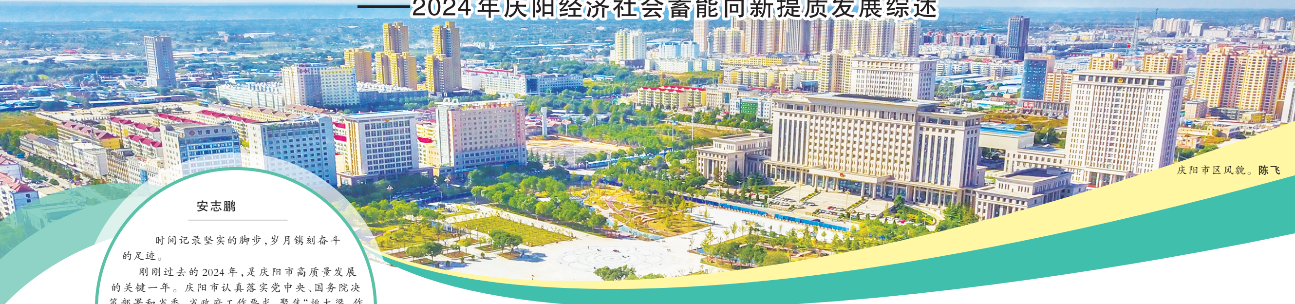
庆阳市区风貌。陈飞