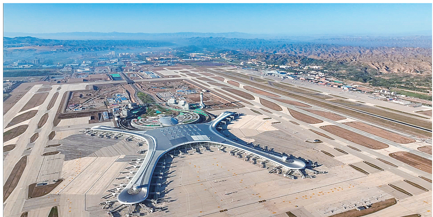
2024年7月31日,中川机场T3航站楼主体工程竣工。