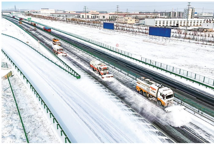
嘉峪关公路事业发展中心在G30连霍高速公路清水至酒泉段开展除雪保畅工作。