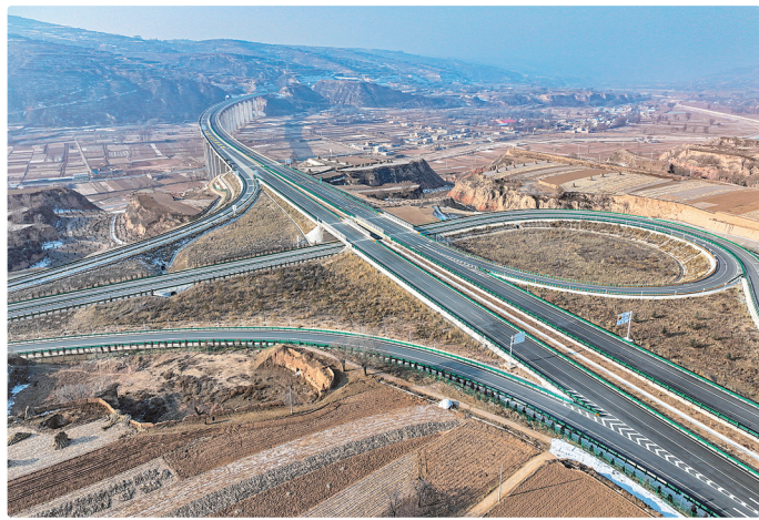
2024年12月20日,定西至临洮高速公路通车。

2024年,我省交通运输系统以推动交通强省建设为总抓手,迎难而上、主动作为,交通事业发展取得了明显成效,为全省经济社会持续向好发展提供了有力支撑。