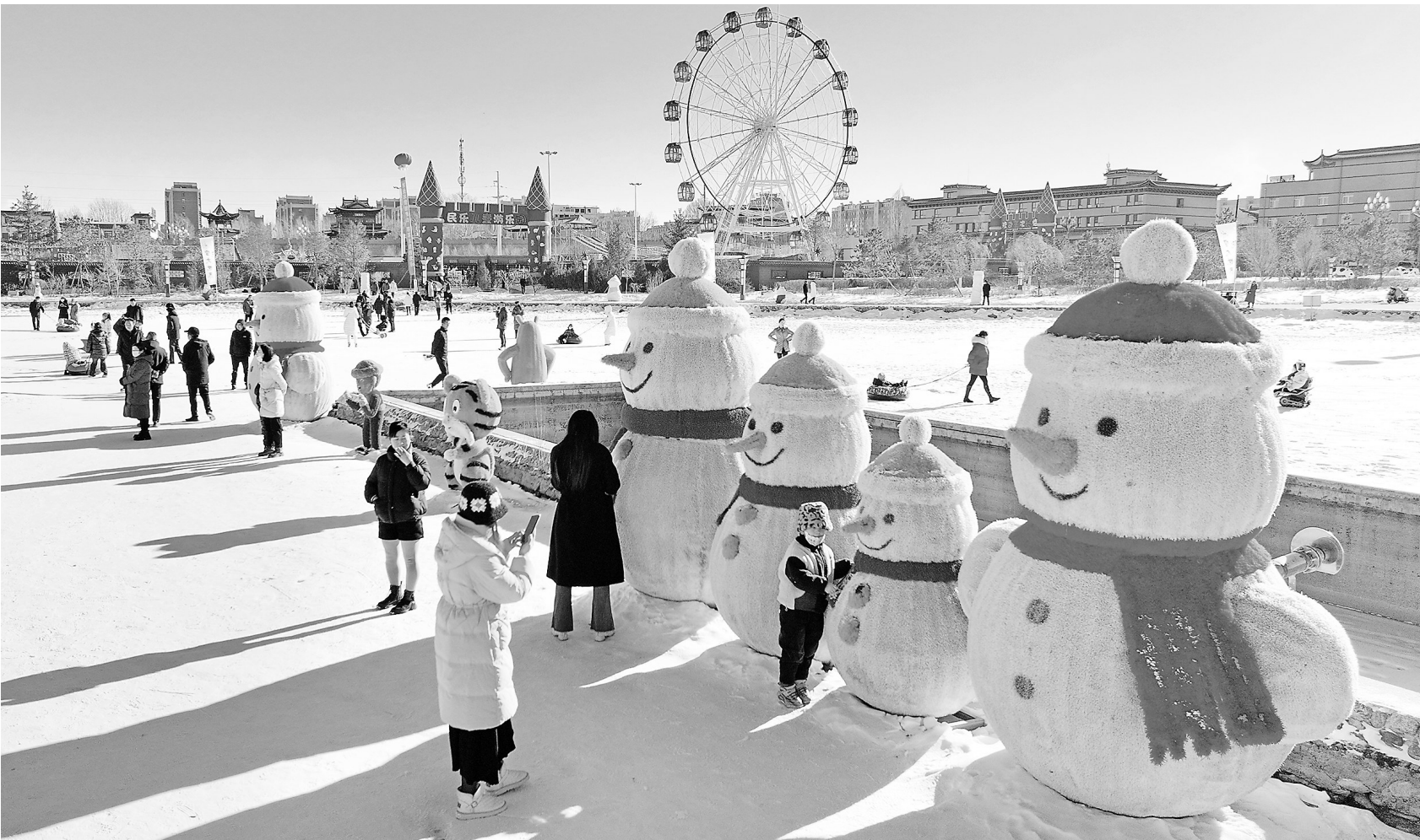
近日,民乐县举行“冰雪嘉年华”活动,游客在冰雪乐园里尽享运动带来的快乐。 新甘肃·甘肃日报通讯员 王晓涇

近日,省委、省政府决定,表彰临夏州积石山县6.2级地震抗震救灾先进集体和先进个人,临夏州应急管理局获得“临夏州积石山县6.2级地震抗震救灾先进集体”称号。