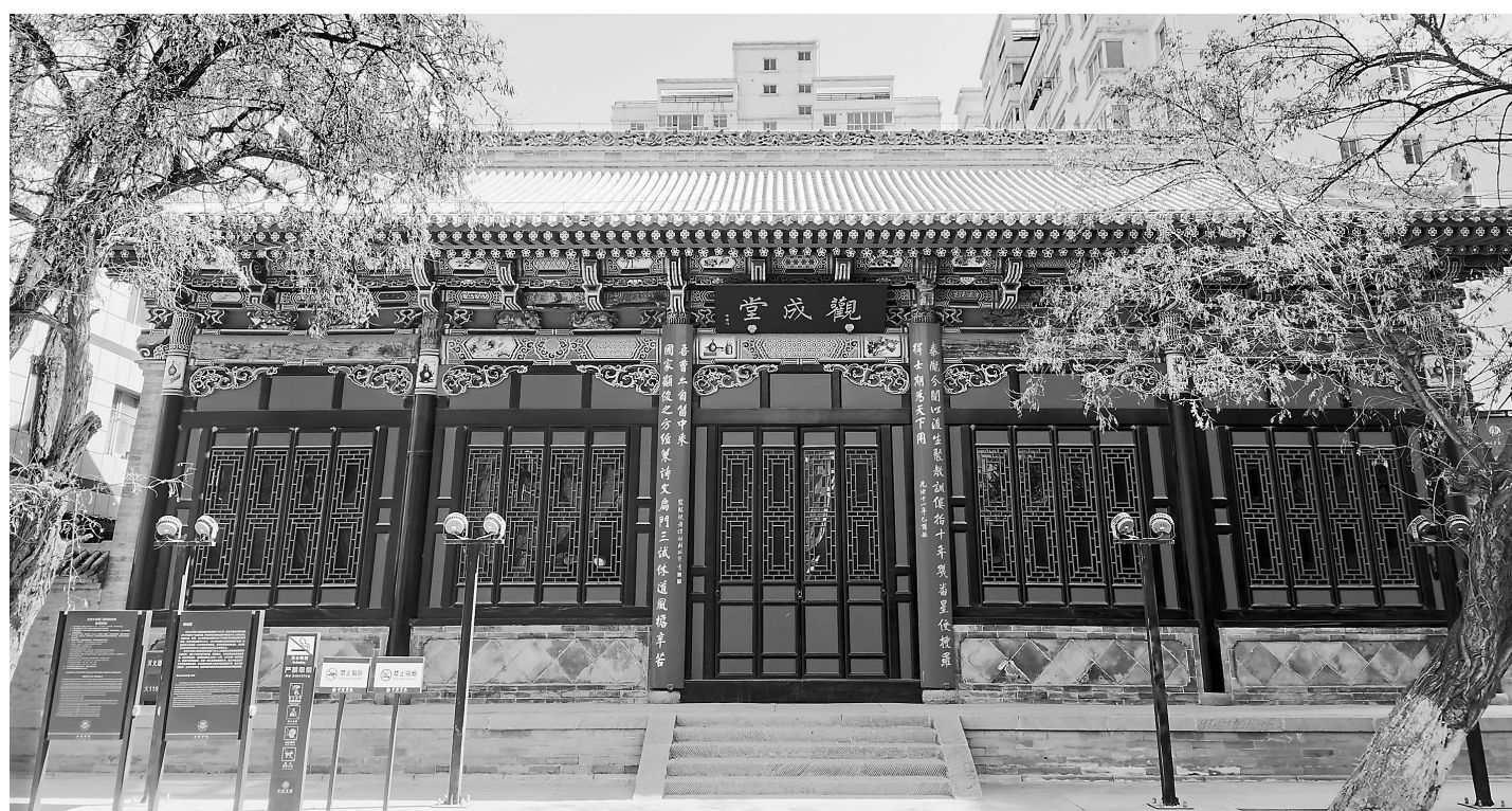
甘肃贡院观成堂楹联 王安