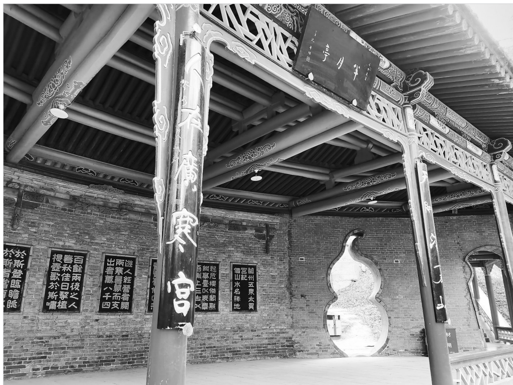
五泉山半月亭楹联 王安