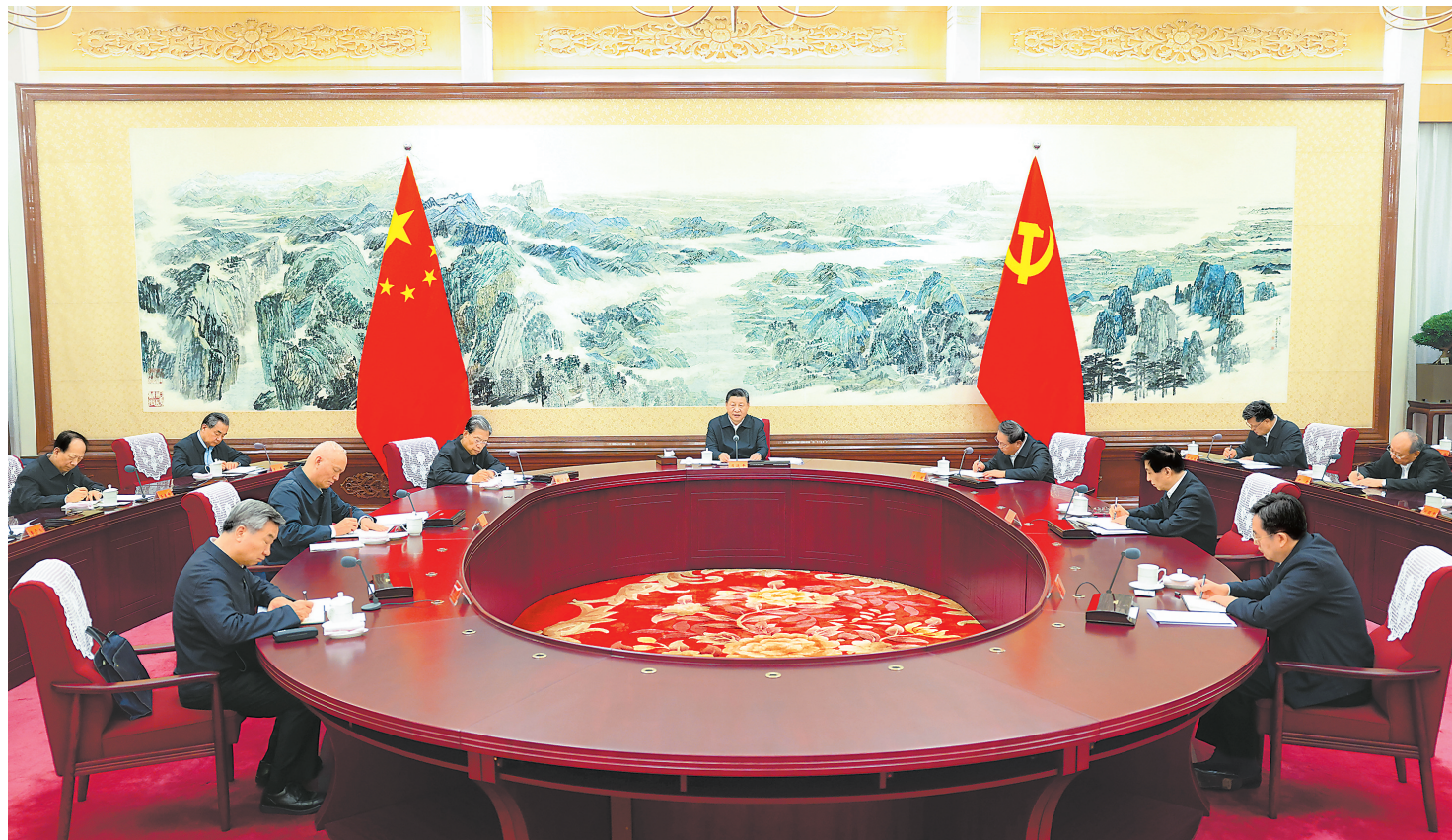
12月26日至27日,中共中央政治局召开民主生活会,中共中央总书记习近平主持会议并发表重要讲话。