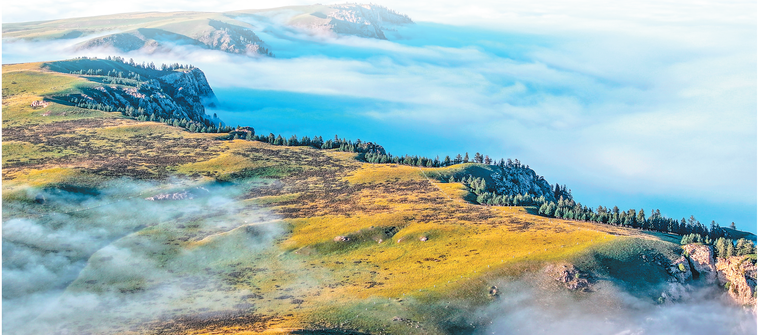
祁连山腹地色彩斑斓。