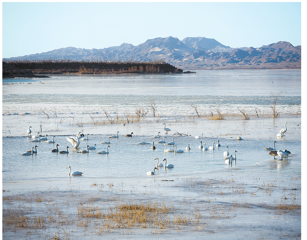
民勤县红崖山水库良好的生态环境引来天鹅栖息。