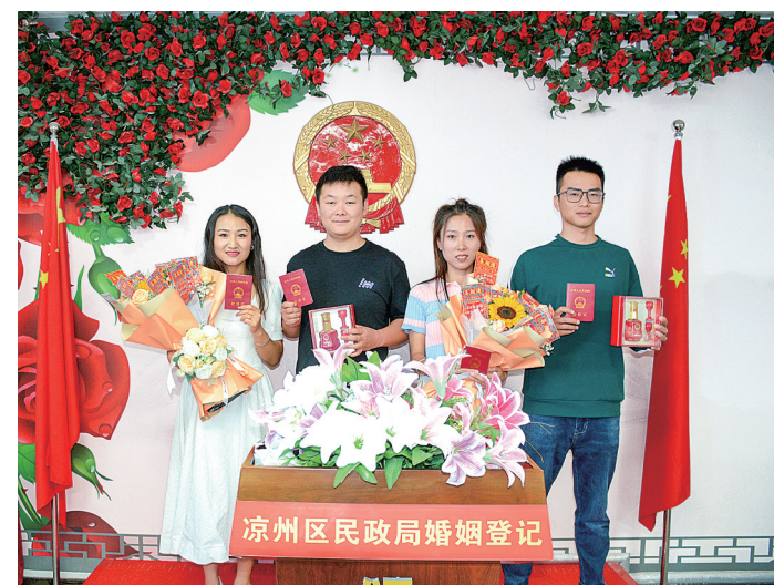
2024年8月10日,中国传统节日七夕节当天,武威市凉州区举行“爱满鹊桥·缘定七夕”结婚登记集体颁证仪式。

——区划地名工作全面加强。2019年以来,兰州市城关区、安宁区、永登县、皋兰县部分行政区划界线变更,武威市古浪县部分乡镇行政区划优化调整,庆阳市6个乡撤乡设镇,张掖市甘州区新墩镇政府驻地迁移,在服务强省会行动、支撑区域新型城镇化发展、巩固拓展脱贫攻坚成果同乡村振兴有效衔接等方面发挥了积极作用。规范地名管理,健全完善机制制度,强化地名普查成果转化应用,编辑出版甘肃省标准地名图、录、典、志。持续加强保护传承,积极弘扬优秀传统文化地名文化。组织开展“保护地名文化,记住美丽乡愁”乡村地名信息服务提升行动,征集红色地名文化作品140余件。其中,庆阳市和酒泉市选送的作品获民政部主题活动三等奖。以“甘肃省地名文化保护与传承”和“甘肃省行政区划历史文化保护与传承”为主题开展调查研究,相关成果分别获得2023年、2024年全国民政政策理论研究二等奖。深入实施“乡村著名行动”,会同11个部门(单位)联合制定《甘肃省“乡村著名行动”实施方案》,推动乡村地名建设重点任务落实,因地制宜开展探索实践,形成了一批可复制、可推广的经验做法。乡村地名全面建设探索实践取得明显成效,积极助力乡村振兴。