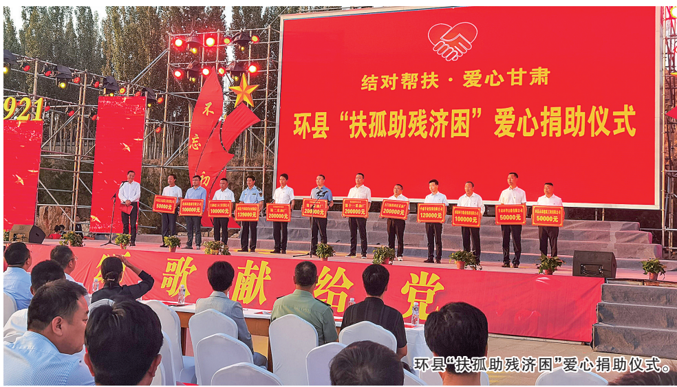
环县“扶孤助残济困”爱心捐助仪式。

——创新兜底方式,深入实施结对关爱行动。省民政厅积极履行省关爱办工作职责,组织全省25.1万名干部与26.7万名关爱对象结对认亲,各级结对干部累计开展联系交流275.11万人次,走访慰问183.96万人次,帮办实事40.8万件,资助资金(含物资折合)9597.59万元。设立结对关爱专项基金。截至目前,全省已筹集资金1.12亿元,帮助33.45万人次关爱对象纾困解难。