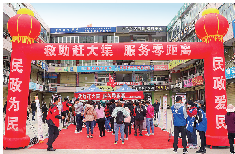
平凉市崆峒区开展“救助赶大集,服务零距离”民政政策大宣讲活动。

积极发展慈善事业。全省慈善组织由2019年的182家发展到目前的288家,实现慈善组织县域全覆盖;慈善信托累计备案162单,备案金额达8.63亿元,位居全国第三。依法治善成为常态。建