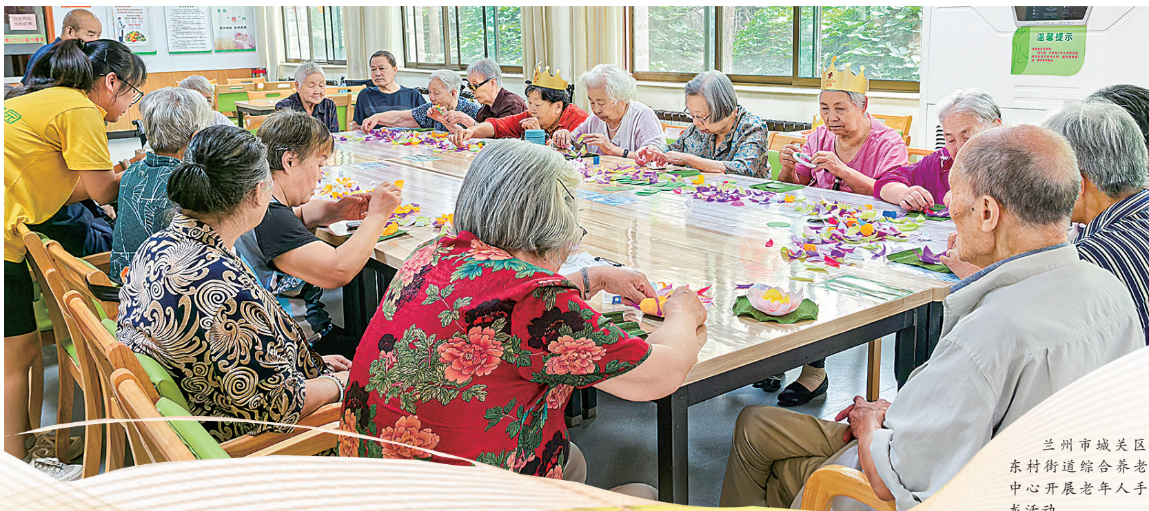
兰州市城关区铁路东村街道综合养老服务中心开展老年人手工沙龙活动。