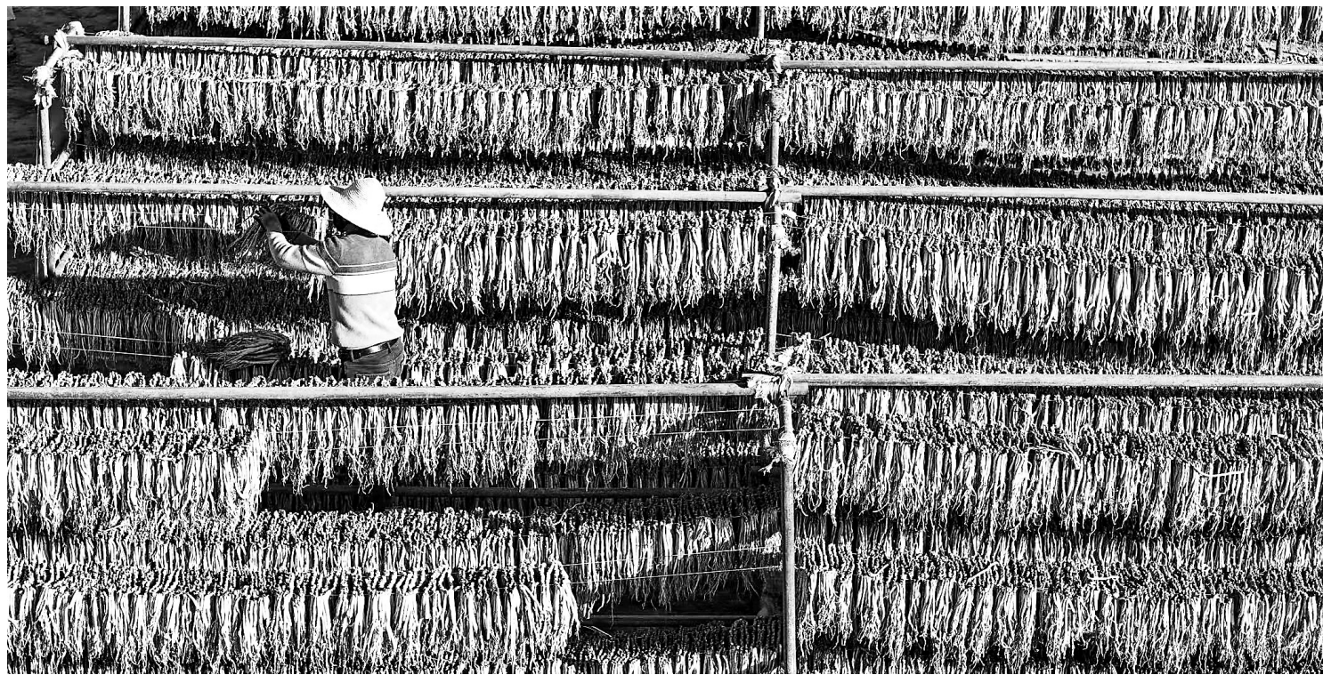
岷县群众晾晒当归。

秦许乡依托“当归佛手片”加工传统，大力发展“当归佛手片”庭院经济，切实将农家小院的“手工活”培养成增加收入的“金饭碗”。如