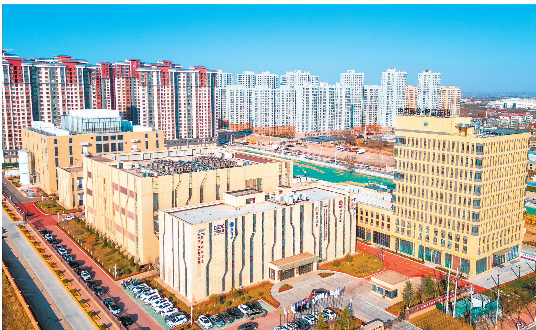
俯瞰庆阳全国一体化算力网络国家枢纽节点“东数西算”产业园。