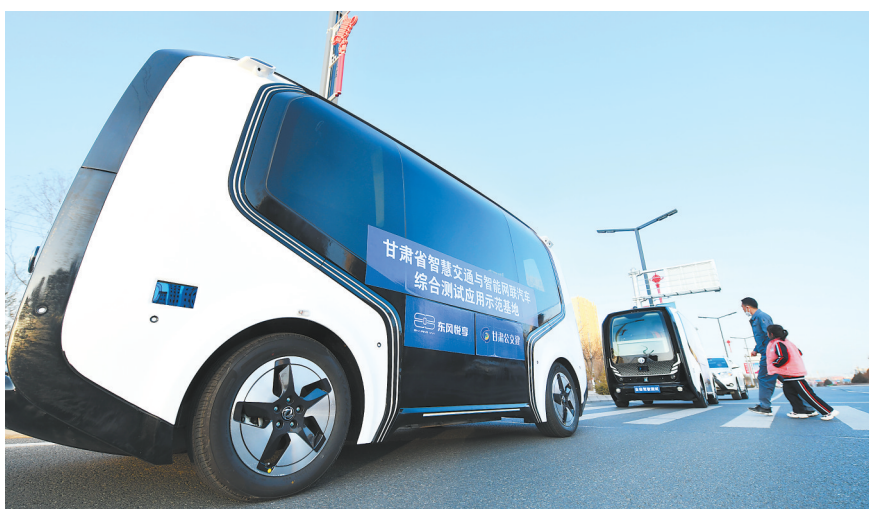
兰州新区数辆自动驾驶动态体验车在“城市开放道路测试区”上路行驶。