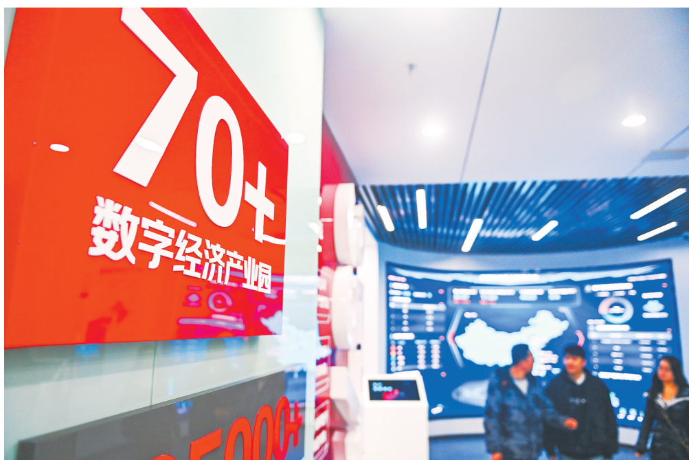
京东(甘肃)数字经济产业园为庆阳企业提供一站式技术赋能、创新孵化、人才培养等服务,实现本地产业数字化转型。