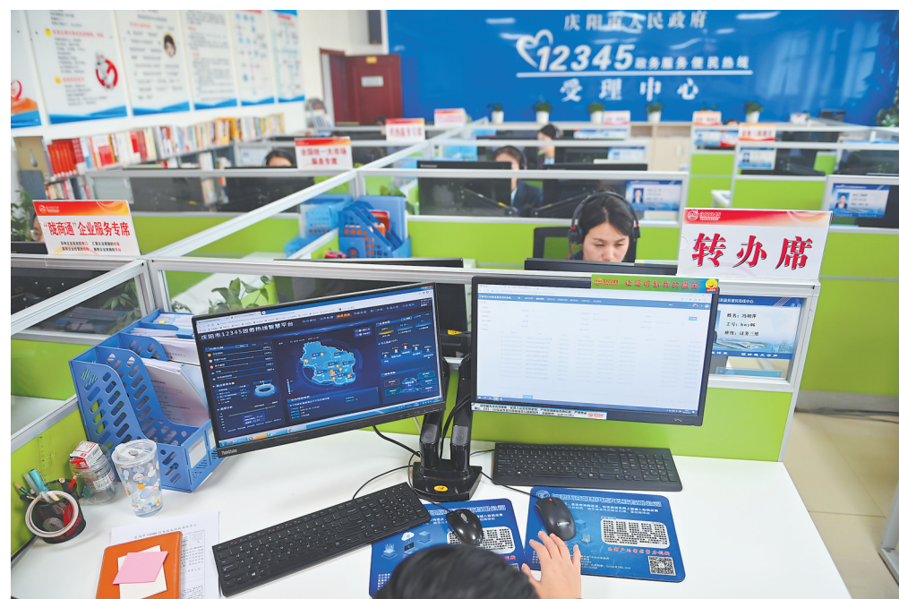
庆阳市12345热线务平台依托一体化算力网络平台算力支撑进行智能化升级,正成为民生服务的“智慧大脑”。