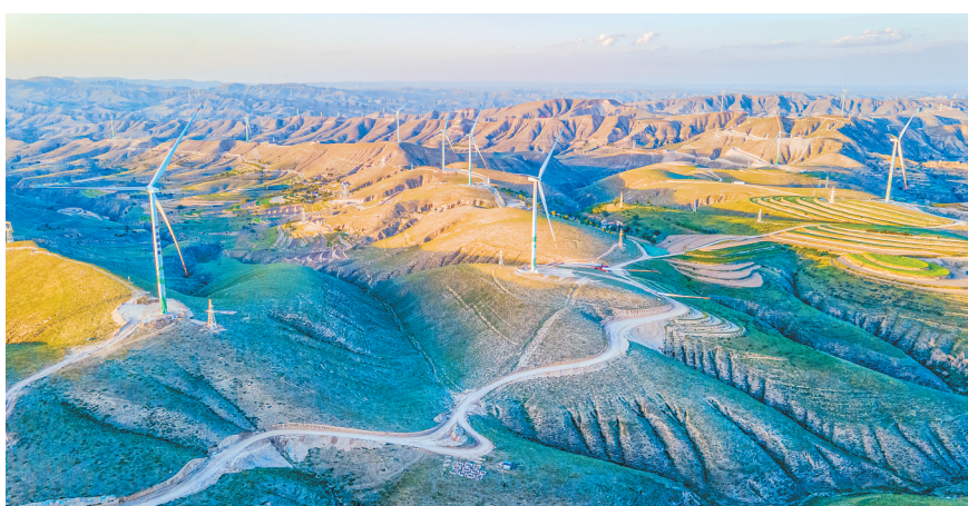
“陇电入鲁”配套华能陇东能源基地600万千瓦风光储综合新能源示范项目蔚为壮观。