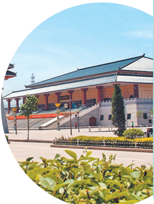
甘肃秦文化博物馆

时过境迁，秦王朝早已消散在历史长河之中，然而在甘肃大地上，依然能够找到许多秦文化的印记。倘若您踏上这片充满古韵的热土，亲身去感受、用心去探寻，那些隐匿在岁月深处、承载着秦文化的动人故事、遗址、遗迹，定会给您带来更多惊喜与触动。让我们一起迈开脚步，在陇原大地，寻秦，感受那缕缕秦风。