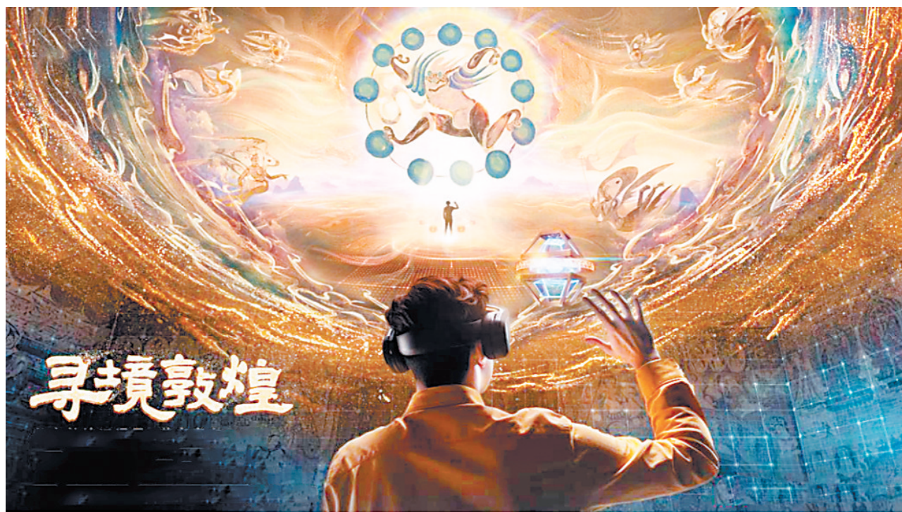
“寻境敦煌”线下VR深度体验场景示意

“寻境敦煌——数字敦煌沉浸展”(以下简称“寻境敦煌”)是敦煌研究院联合腾讯共同推出的深度文化知识互动项目,应用了VR、三维建模、游戏引擎的物理渲染和全局动态光照的新技术,对敦煌莫高窟285窟的面貌进行了重现和还原。游客既能在线上参与知识互动,又能在线下的沉浸式展馆中通过VR眼镜,深度体验艺术灵韵,感受深厚敦煌文化。“寻境敦煌”以数字赋能文物保护,以技术助力文旅发展,推动数字经济与旅游业深度融合,让敦煌历史的瑰宝在新时代焕发出新的光彩。