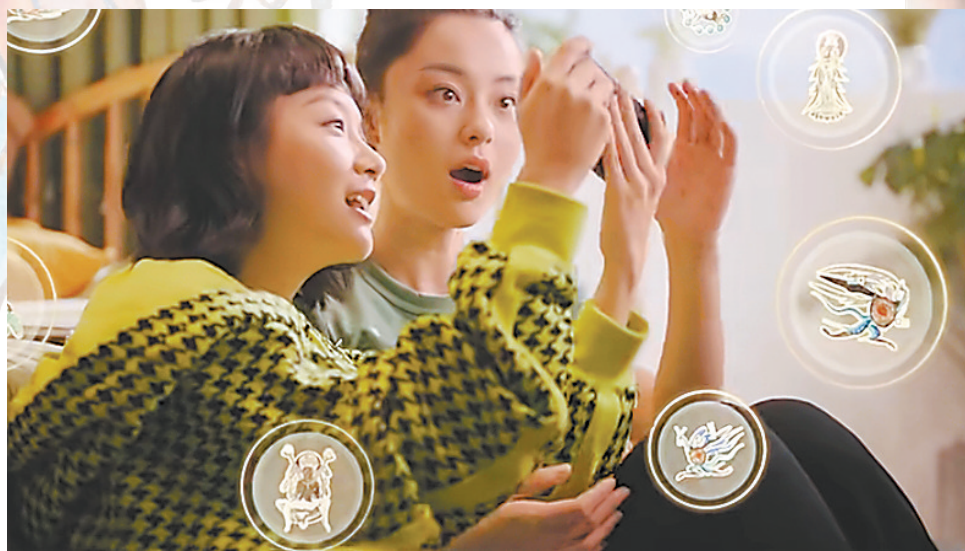
游览前 提前了解洞窟知识点