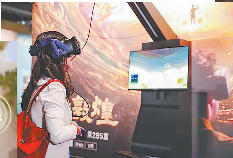
游览中 沉浸式VR漫游