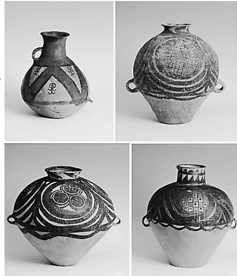
意大利返还中国的马家窑文化彩陶器。

11月8日,意大利返还的56件中国文物艺术品回归祖国,其中不乏多件马家窑文化彩陶。