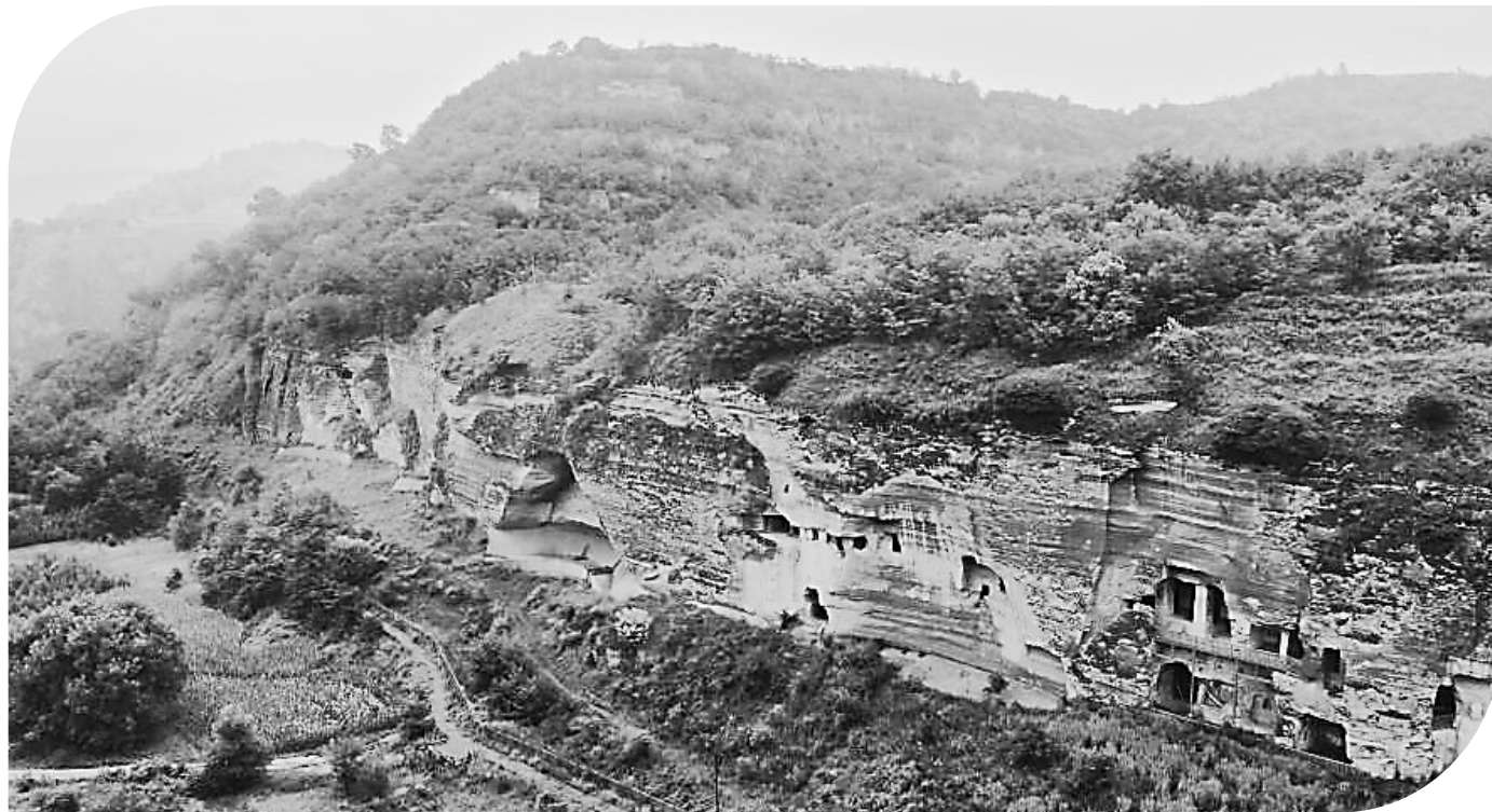
平凉市泾川县百里石窟长廊中的罗汉洞石窟。李亚龙