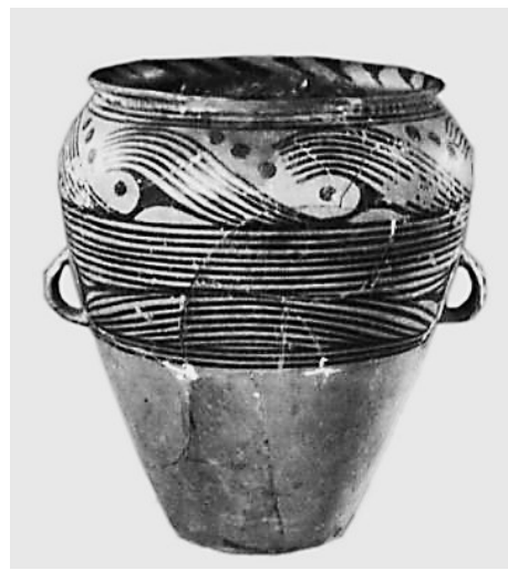
马家窑类型彩陶瓮 林家遗址出土

大夏河流域作为马家窑文化分布的核心地带,囿于考古学资料的匮乏,一直未受到学界的重点关注。此次林家遗址重新启动,以及围绕大夏河流域今后开展的一系列考古调查与发掘工作,对于全面探索马家窑文化,更全面地了解马家窑文化时期的社会