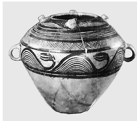
马家窑类型彩陶四钮罐 林家遗址出土

生活、经济发展等方面的信息,深入揭示马家窑文化内涵,活化马家窑文化的社会意义,以及探索早期青铜冶炼及冶金起源问题和构建大夏河流域考古学文化序列具有十分重要的学术意义。