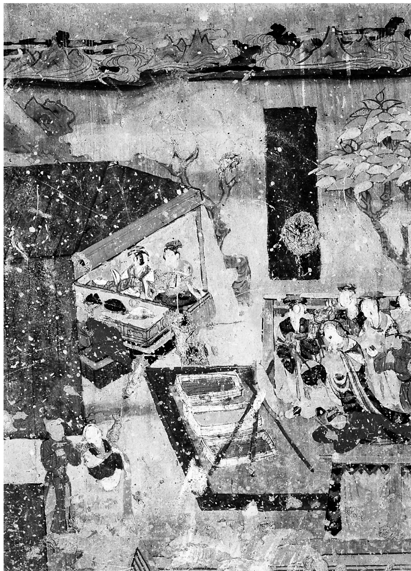
莫高窟第12窟 婚嫁图

(《华夏日常生活史》,李志生著,北京大学出版社出版。本文作者系陕西师范大学历史文化学院教授)