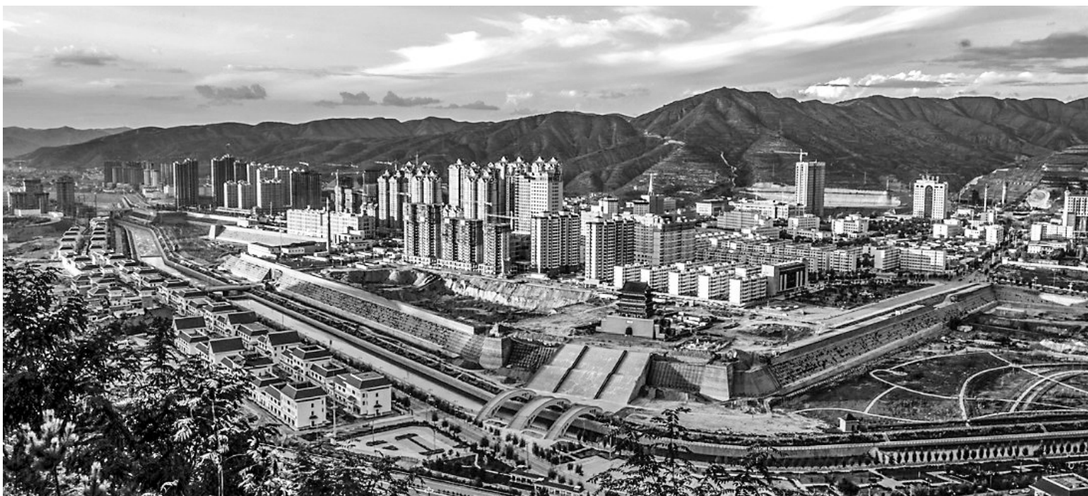
会宁县城一角。资料图

化了讲述的功能,是一部老少皆宜的大众读本。以历史为轴线,以戏剧为中心,严谨客观地阐明了会宁县戏剧发展的辉煌历程,分析归纳了会宁县戏剧艺术薪火相传的成因所在,准确定位了会宁县戏剧事业在文化艺术中的优势功能和社会经济发展中的独特作用,具有权威性、公正性和全面性。同时,生动真实地讲述了戏剧发展进程中的感人故事,尤其对四个戏剧世家和对会宁戏剧事业做出重要贡献的人物,进行了栩栩如生的描写,刻画了他们艰辛的奋斗历程和鲜为人知的生动细节,读来感人肺腑,扣人心弦。值得一提的是,书中收录了许多非常珍贵的口述资料,为会宁文化艺术事业的发展留下了一份珍贵的“活档案”。这种以史为主、以述为辅的写作手法,新颖独到,趣味横生,创