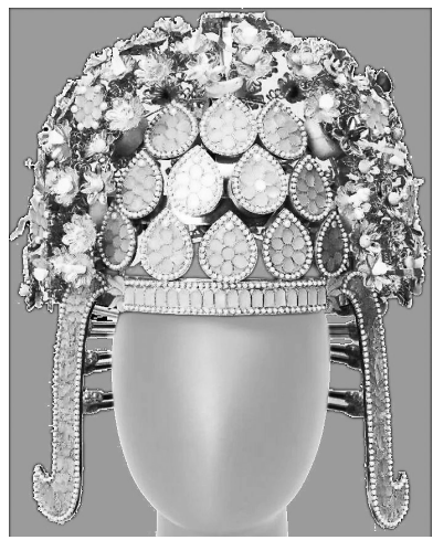
钿钗礼冠 唐 扬州萧后墓出土

日常生活史的研究兴起于20世纪70年代,时至今日,其研究领域出现了众多优秀著作,李志生的新著《华夏日常生活史》便是其中之一。该书以物品和图像切入历史,再以历史观照生活,双向往复,让华夏5000年的日常变得形象可感。