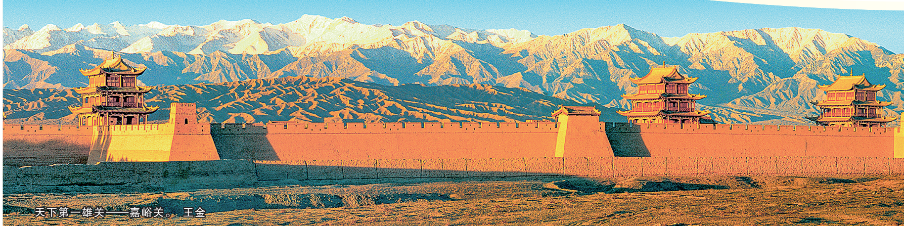
天下第一雄关——嘉峪关。王金