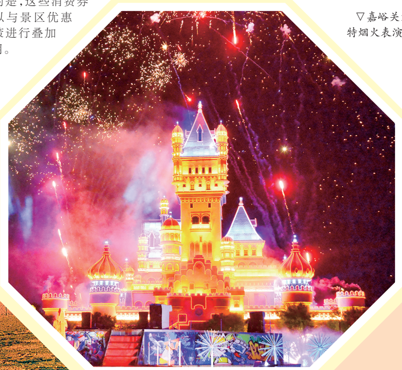
嘉峪关方特烟火表演。

嘉峪关通过这些精心设计的课程和优惠活动,为游客带来更多体验和便利,进一步推动传统文化的传承与发展,为冬春季研学旅行市场注入新的活力。