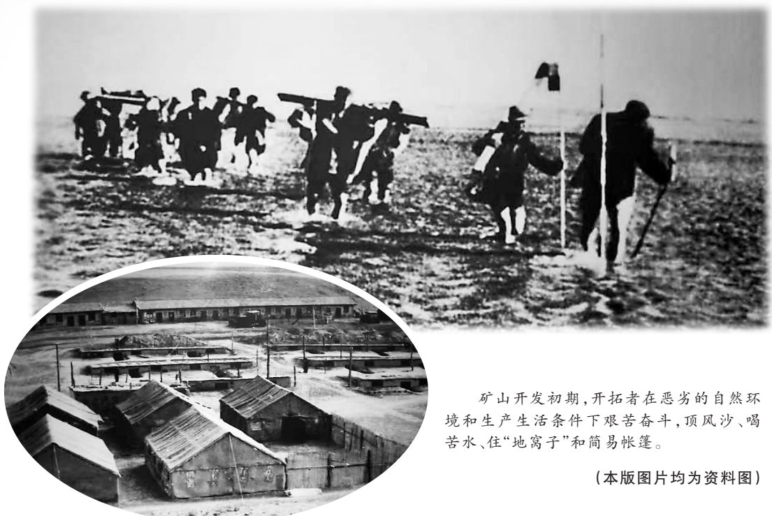
矿山开发初期,开拓者在恶劣的自然环境和生产生活条件下艰苦奋斗,顶风沙、喝苦水、住“地窝子”和简易帐篷。

1956年12月31日,随着一声惊天动地的巨响,吹响了向白银矿山进军的号角,开启了“共和国有色金属工业长子”白银公司的崛起之路。一大批来自五湖四海的建设者,怀着发展我国有色金属工业的强烈愿望来到这里,以敢为人先、改天换地的革命豪情,挥洒汗水、奉献青春,铸就了艰苦奋斗、创业奉献的宝贵精神,谱写了共和国有色金属开发历史上的灿烂华章。