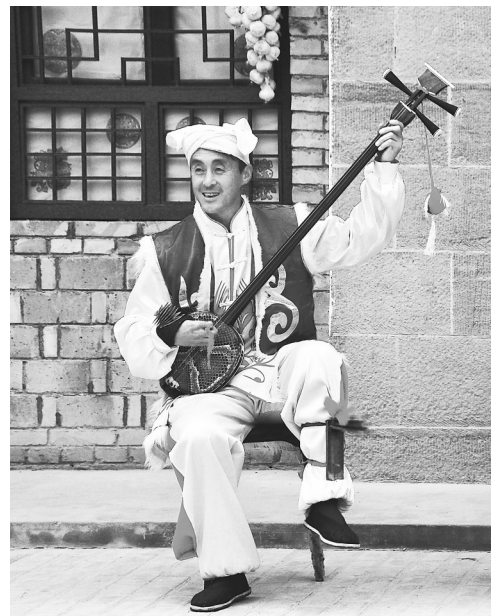
南梁说唱表演

2006年,南梁说唱入选第一批甘肃省非物质文化遗产名录。2023年2月,南梁说唱入选第一批全国“一县一品”特色文化艺术典型案例名单。华池县还建设了南梁说唱传习所、非遗工坊,并通过创编新曲目、传承人培训、完善艺人网上艺术档案、举办“南梁说唱红色旅游艺术节”等形式,让南梁说唱在新时代绽放新的风采。(封康康)