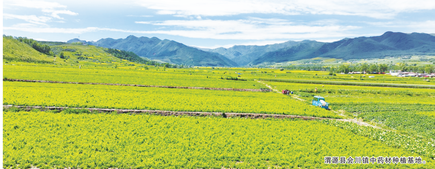
渭源县会川镇中药材种植基地。

渭源县正以崭新的姿态,迎接高质量发展的新时代,阔步行进在中国式现代化的伟大征程上。