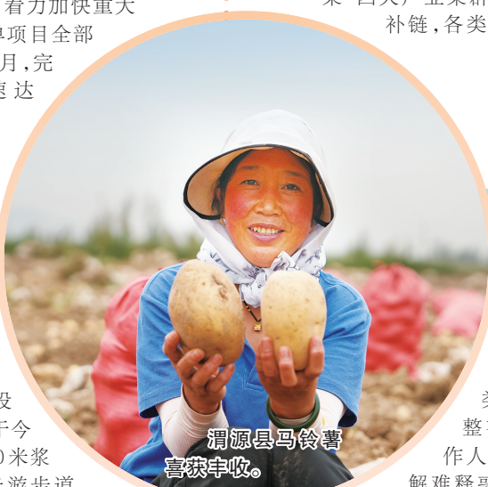
渭源县马铃薯喜获丰收。

——抓入库的方式不断改进。全力摸排在建投资项目,尽快适应投资项目统计入库新政策,夯实统计基础,做实统计支撑,全力推动投资项目入库入统,做到应统尽统、颗粒归仓,不断做大投资总量。1月至10月,全县累计新入库项目87项,总投资41亿元,为全年固定资产投资奠定了坚实基础。