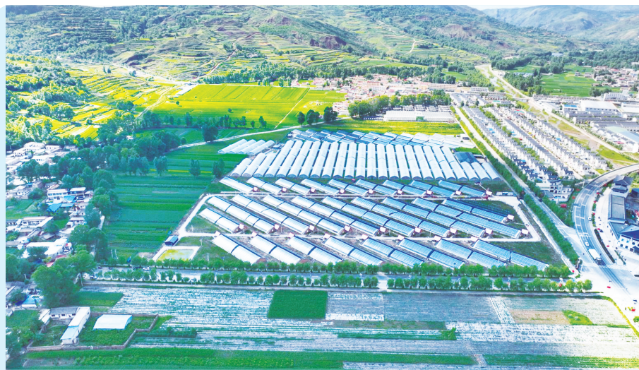
渭源县上湾镇花卉产业基地。

今年以来,渭源县主动融入“一区三地”建设布局,锚定高质量追赶发展目标定位,以更高站位、更实举措,奋楫扬帆、笃行实干,全力推进项目建设,持续优化营商环境,全面发展壮大特色产业,奏响了高亢嘹亮的奋进之歌,全县经济实现质的有效提升和量的合理增长,中国式现代化渭源建设迈出铿锵步伐。