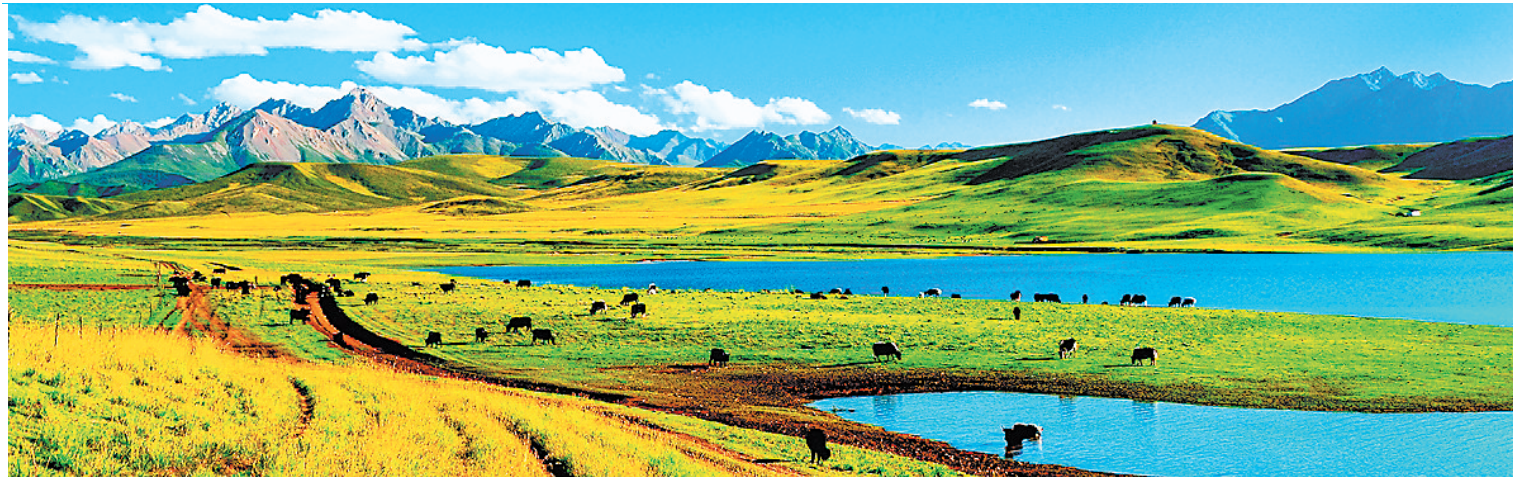
永昌西大河水库风光。资料图

在历史的长河中,甘肃以其独特的地理风貌、悠久的人文历史和丰富的民族文化,书写着属于自己的华章。《如意甘肃·甘肃省情研究》一书正是对这片土地的深情描绘。它不仅是对甘肃省情的全面梳理,更是一幅展现甘肃现代化征程的壮丽画卷。