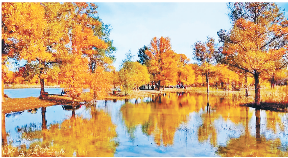
甘肃金塔胡杨林风光。资料图

在“美好未来”章节中,作者深情地描绘了甘肃人民对美好生活的向往,以及实现这一愿景所应遵循的道路。这里既有对传统文化的继承,也有对现代化建设的期许,展现了