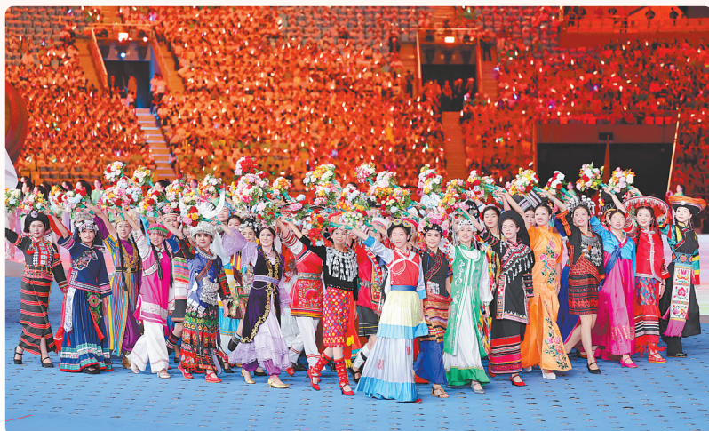
演员在开幕式上表演。