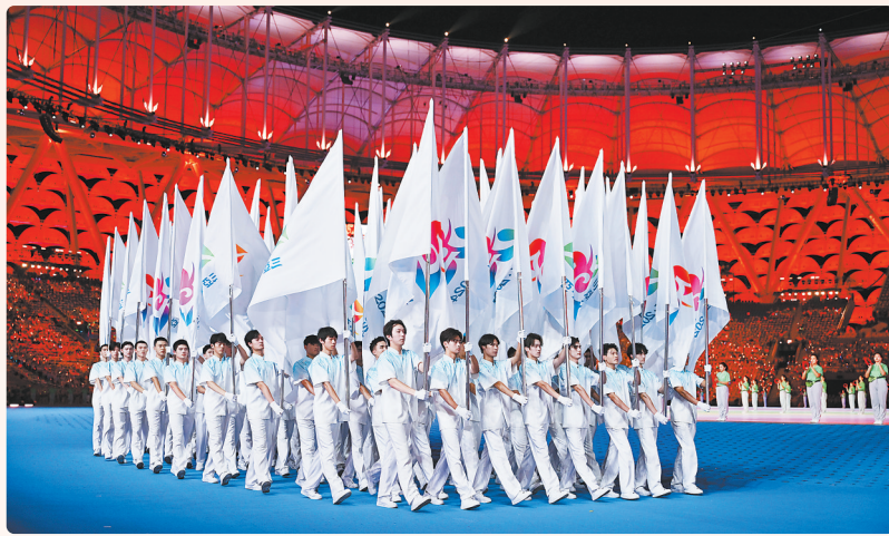
第十二届全国少数民族传统体育运动会会旗方阵入场。