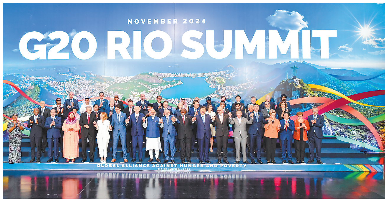
当地时间11月19日中午,国家主席习近平在里约热内卢出席二十国集团领导人第十九次峰会闭幕会议。这是闭幕会议后,习近平同其他与会领导人合影。