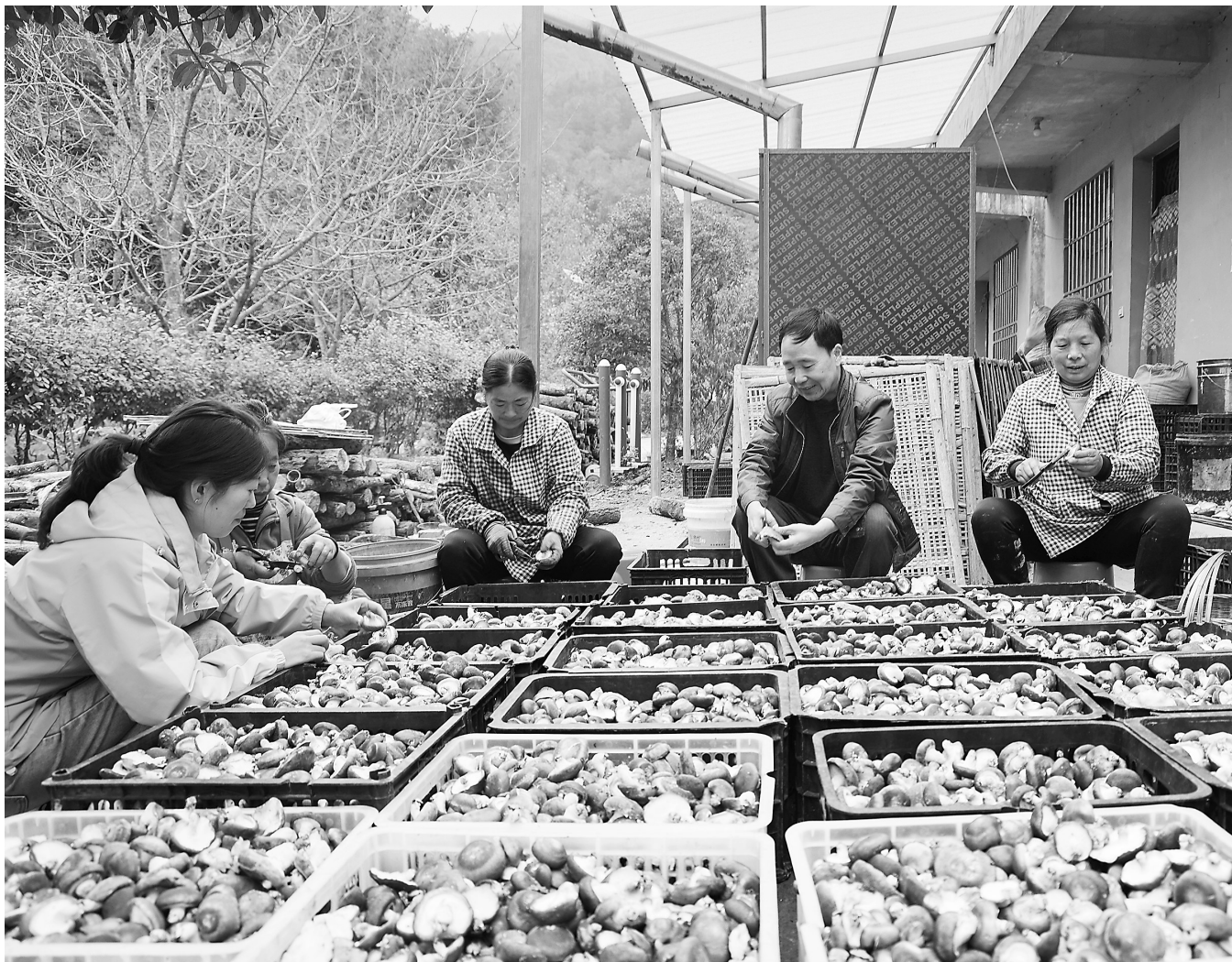
近日,康县白杨镇朱家沟村农民正在采收椴木香菇。近年来,朱家沟村采取“村集体经济合作社+基地+农户”的经营发展模式,依托丰富的林地资源优势,因地制宜发展椴木香菇、木耳、天麻等特色产业,助力农民增收。

连续三年,中寨小学教育教学综合成绩排名全县第一,学业质量多年保持在全县村级小学“第一方阵”。