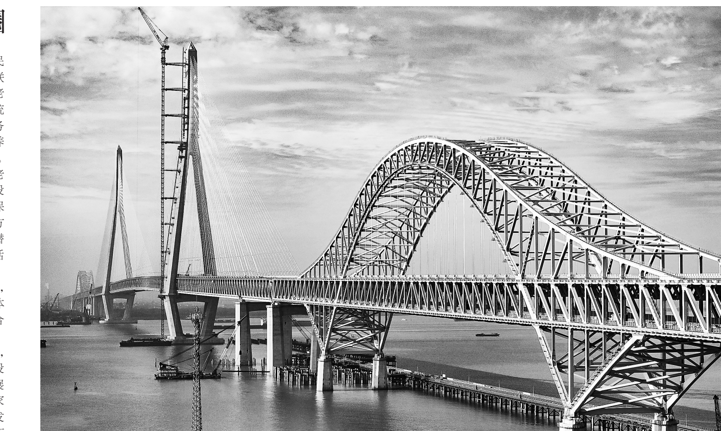
图为11月10日拍摄的建设中的常泰长江大桥。11月9日,经过近三个月的紧张施工,常泰长江大桥上下层钢桥面主体结构全部完成。这是这座世界最大跨度斜拉桥全线贯通后,工程建设取得的又一次重大进展。

欧洲理事会主席米歇尔会前表示,过去20年间,欧盟的国内生产总值在全球所占比例已减半,形势令人担忧。在此背景下,欧盟领导人在会上重点围绕今年4月欧盟特别峰会上提出的加强竞争力的驱动