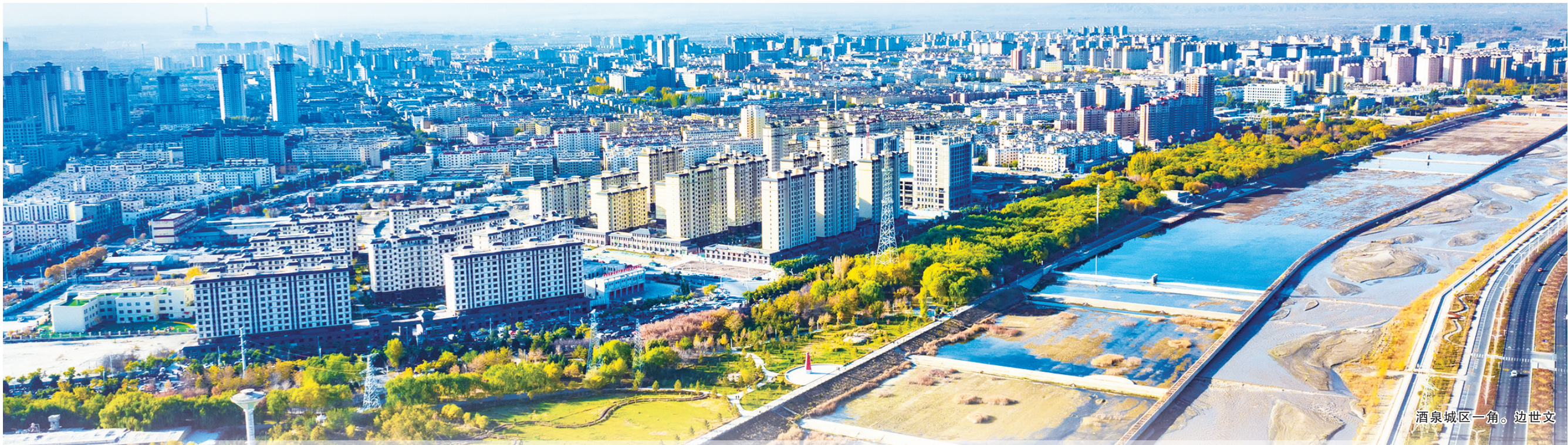
酒泉城区一角。边世文