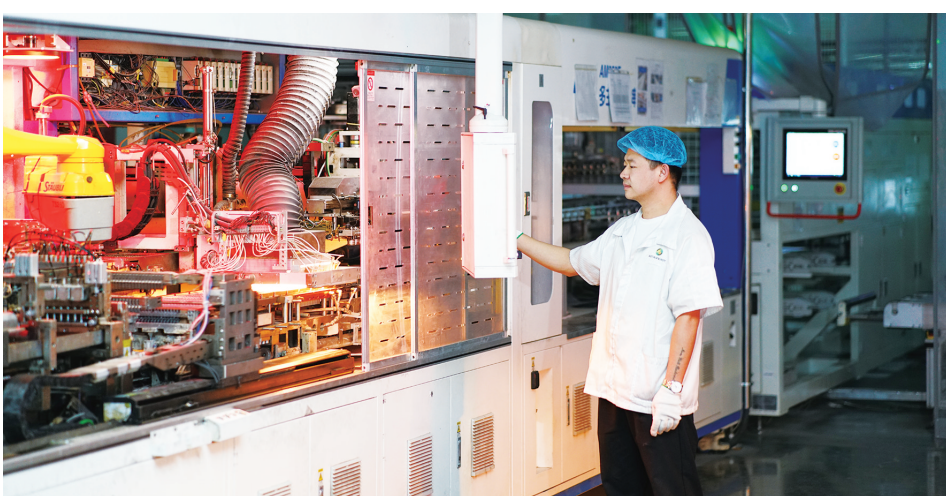
酒泉经开区的正泰光伏装备智能制造产业基地光伏组件生产线上,工人在生产订单产品。

工业项目不断落地,建设进度持续加快。今年以来,酒泉市认真贯彻落实全省经济运行调度会议精神,牢固树立“项目为王”理念,坚持日监测、周调度、旬预警等工作机制,工作专班赴县区调研督导,包抓联精准服务,深入掌握工业主导行业和重点企业运行情况,及时协调解决困难问题,持续优化调整工业增长结构,不断增强工业经济韧性,全力抓好工业经济稳增长。前三季度,酒泉第二产业规上工业增加值同比增长12.6%,较上半年提升1.7个百分点。