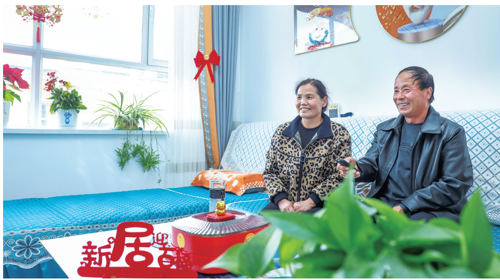
今年6月,金塔县中东镇团结村生态及地质灾害避险搬迁项目落成。图为村民在宽敞明亮的新房子里看电视。冯乐凯

今年以来,酒泉市深入学习贯彻习近平总书记对甘肃重要讲话重要指示精神,全面落实党中央、国务院决策部署和省委、省政府工作安排,全力以赴提信心、稳生产、扩投资、促消费,多点发力支持实体经济提质增效,加快培育壮大新质生产力,全市农业生产稳步提升,工业生产加速提速,服务业发展态势良好,投资运行总体平稳,消费市场持续火热,居民收入持续稳增,经济运行保持了良好发展势头。