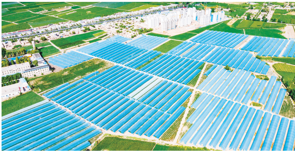
肃州区总寨镇店南村300亩连片高标准钢架拱棚蔬菜种植区。边世文