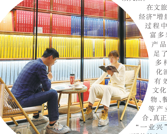
游客沉浸在敦煌书局,享受阅读时光。董文龙

从借力借势重大项目 and 优质资源,到敦煌鸣沙山万人星空演唱会刷屏“朋友圈”,文旅促销引流举措的频频求变和出新,有力带动了酒泉文旅产业的持续火热。