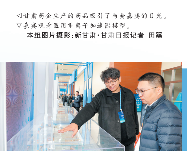
甘肃药企生产的药品吸引了与会嘉宾的目光。 嘉宾观看医用重离子加速器模型。