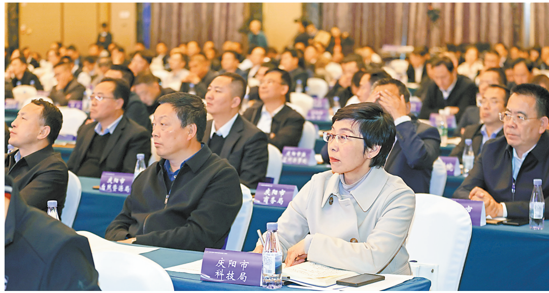
数字经济产业专题对接活动中,参会嘉宾认真聆听演讲。 新甘肃·甘肃日报记者 高楠

如今的甘肃,在轻工及生物制造领域拥有完善的产业基础、良好的投资环境和广阔的市场空间,正张开怀抱,诚挚邀请海内外企业家走进甘肃、了解甘肃、投资甘肃。