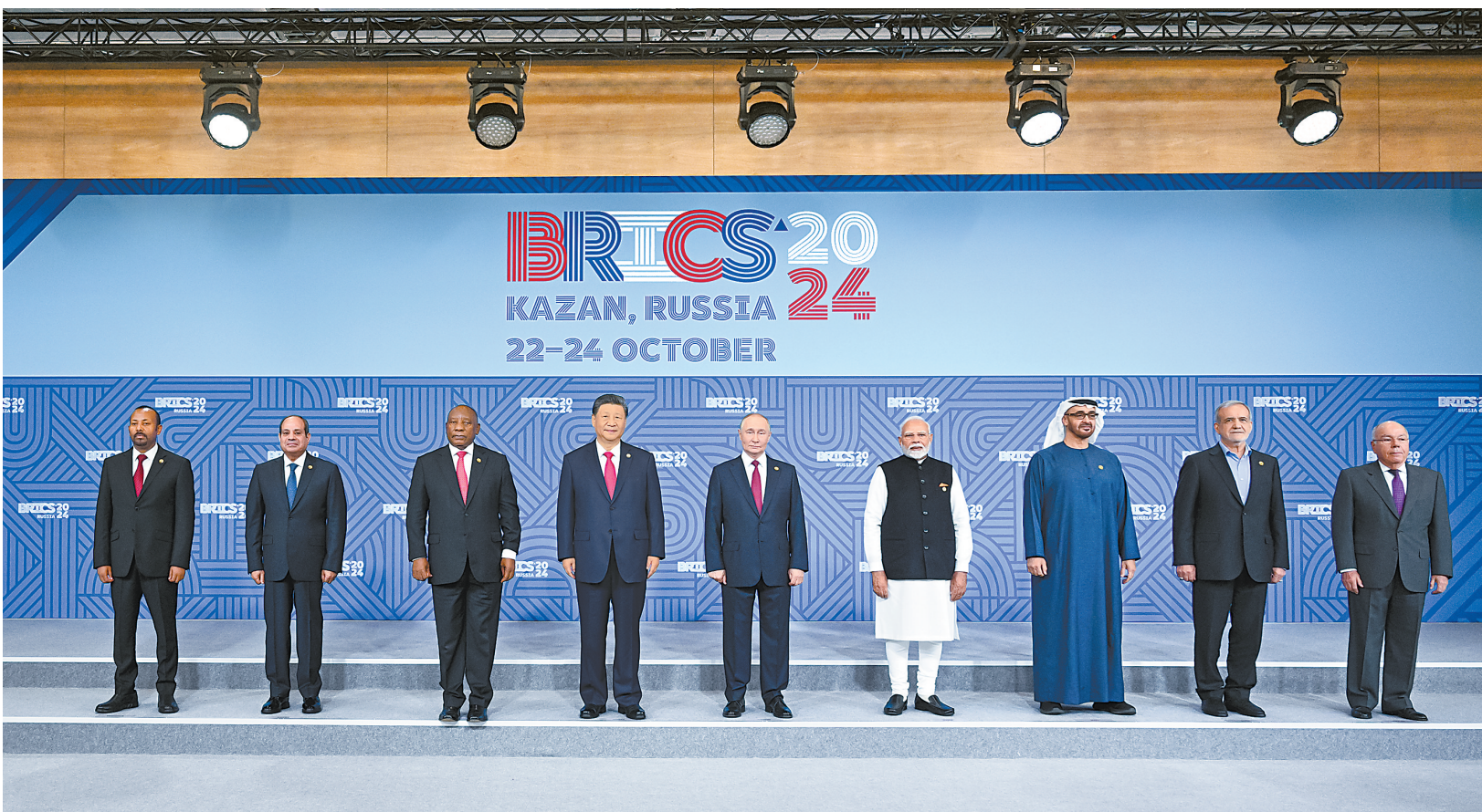
当地时间10月23日上午,金砖国家领导人第十六次会晤在喀山会展中心举行。俄罗斯总统普京主持会晤。中国国家主席习近平、巴西总统卢拉(线上)、埃及总统塞西、埃塞俄比亚总理阿比、印度总理莫迪、伊朗总统佩泽希齐扬、南非总统拉马福萨、阿联酋总统穆罕默德等出席。这是会晤期间,金砖国家领导人集体合影。

新华社俄罗斯喀山10月23日电(记者倪四义 胡晓光)当地时间10月23日上午,金砖国家领导人第十六次会晤在喀山会展中心举行。俄罗斯总统普京主持会晤。中国国家主席习近平、巴西总统卢拉(线上)、埃及总统塞西、埃塞俄比亚总理阿比、印度总理莫迪、伊朗总统佩泽希齐扬、南非总统拉马福萨、阿联酋总统穆罕默德等出席。