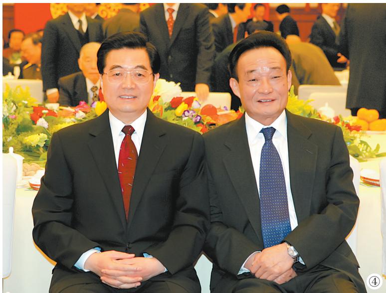
图④:二〇〇五年一月一日,全国政协在北京举行新年茶话会。这是胡锦涛同志与吴邦国同志在一起。