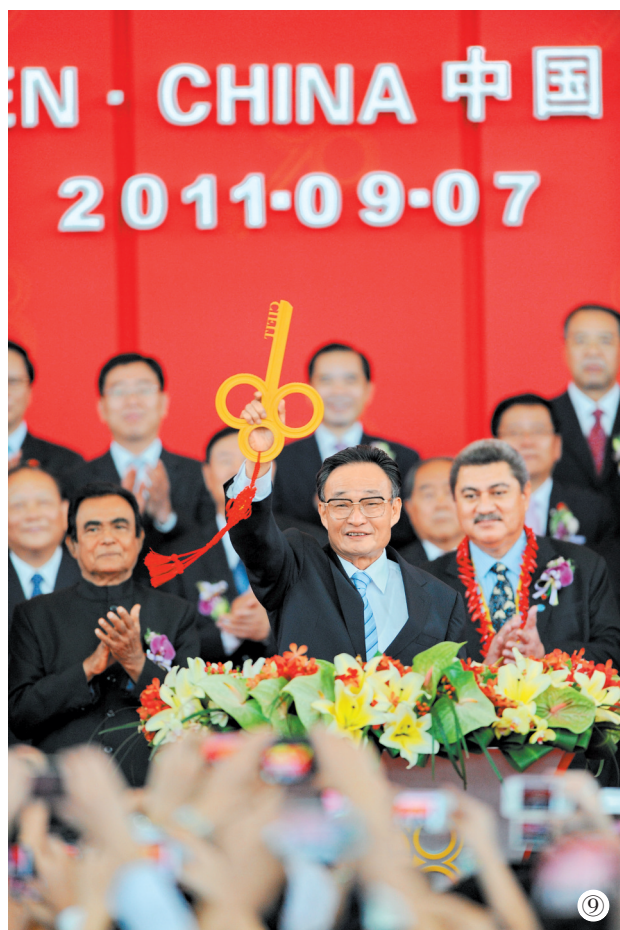
图⑨:二〇一一年九月七日,吴邦国同志在福建厦门出席第十五届中国国际投资贸易洽谈会开幕式。