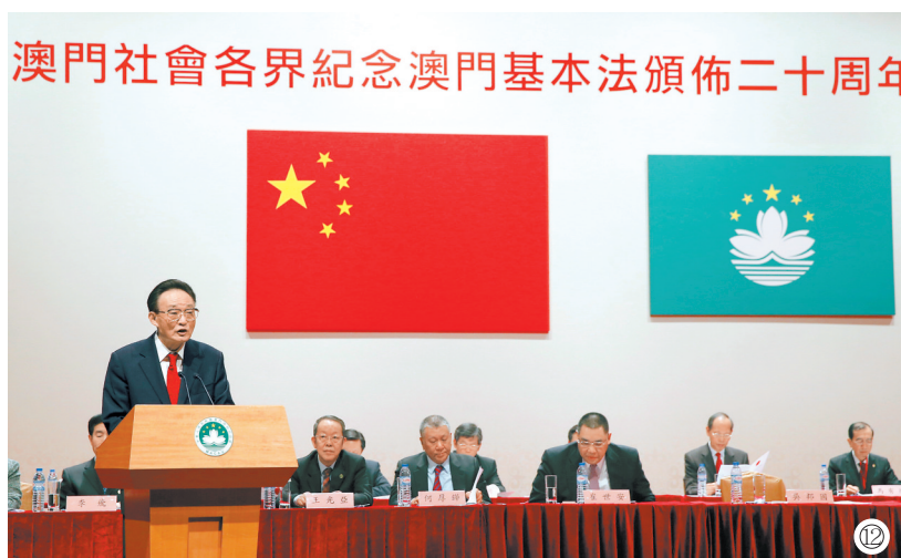
图⑫:2013年2月21日,吴邦国同志在澳门文化中心出席澳门社会各界纪念澳门基本法颁布20周年启动大会并发表讲话。