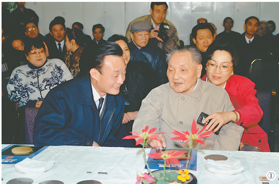
图①:1992年2月10日,邓小平同志在上海贝岭微电子制造有限公司参观时与吴邦国同志交谈。