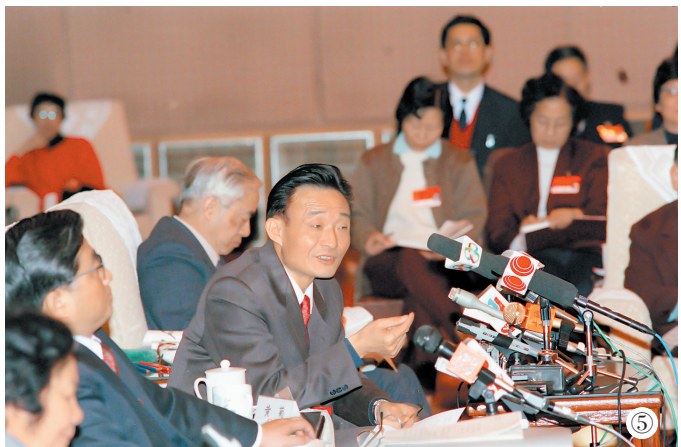
图⑤:1994年3月,时任上海市委书记的吴邦国同志在全国两会上海代表团全团会议上。