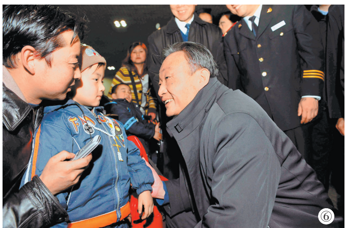
图⑥:2008年2月3日,吴邦国同志在北京西站候车室与旅客交谈。