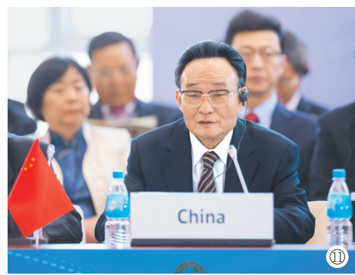
图⑪:2013年1月28日,吴邦国同志在俄罗斯符拉迪沃斯托克出席亚太经合组织第21届年会,并作题为《坚持和平发展 促进合作共赢》的主旨发言。