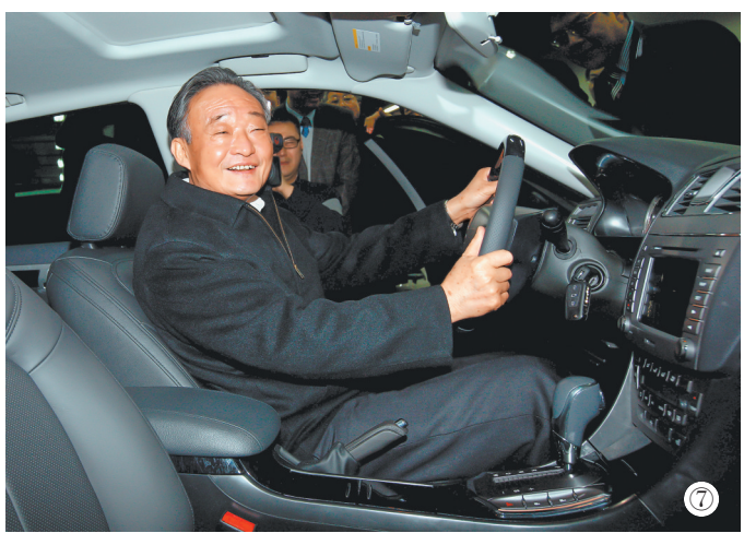
图⑦:2010年1月30日,吴邦国同志在上海汽车集团股份有限公司技术中心察看新能源车。