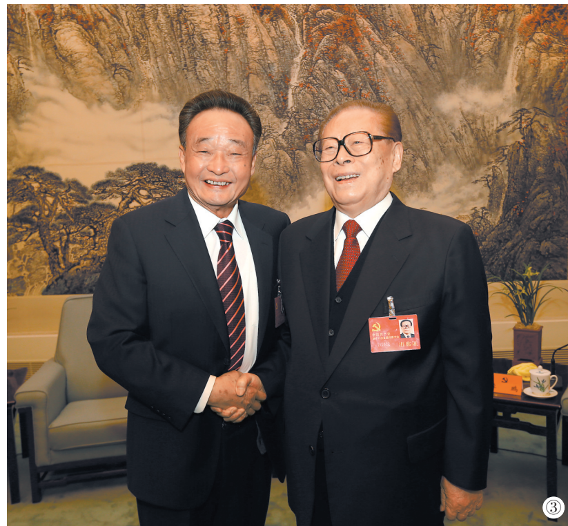
图③:2012年11月14日,中国共产党第十八次全国代表大会在北京闭幕。这是闭幕会前,江泽民同志与吴邦国同志在一起。