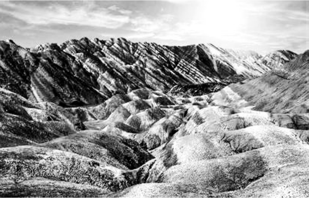
彩色丘陵(本版图片均为资料图)

落,山体映在阳光里,色彩分外明丽,如仙女身披金缕玉衣,熠熠泛光,恍如仙境,令人惊叹不已。站在山脊上,一边是绿野包裹的村庄,一边是翻涌的色彩海洋,一极远古,一极现代,有一种洞穿时光隧道的感觉。