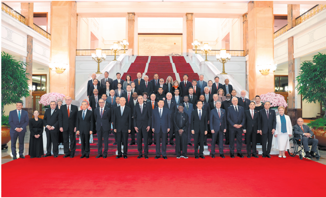
10月11日上午,国家主席习近平在北京人民大会堂集体会见出席中国国际友好大会暨中国人民对外友好协会成立七十周年纪念活动的外方嘉宾。这是习近平同部分外方嘉宾代表合影留念。

外国前政要、王室成员、国际友好组织负责人、友好人士等约200人出席。蔡奇、韩正、王毅等参加会见。