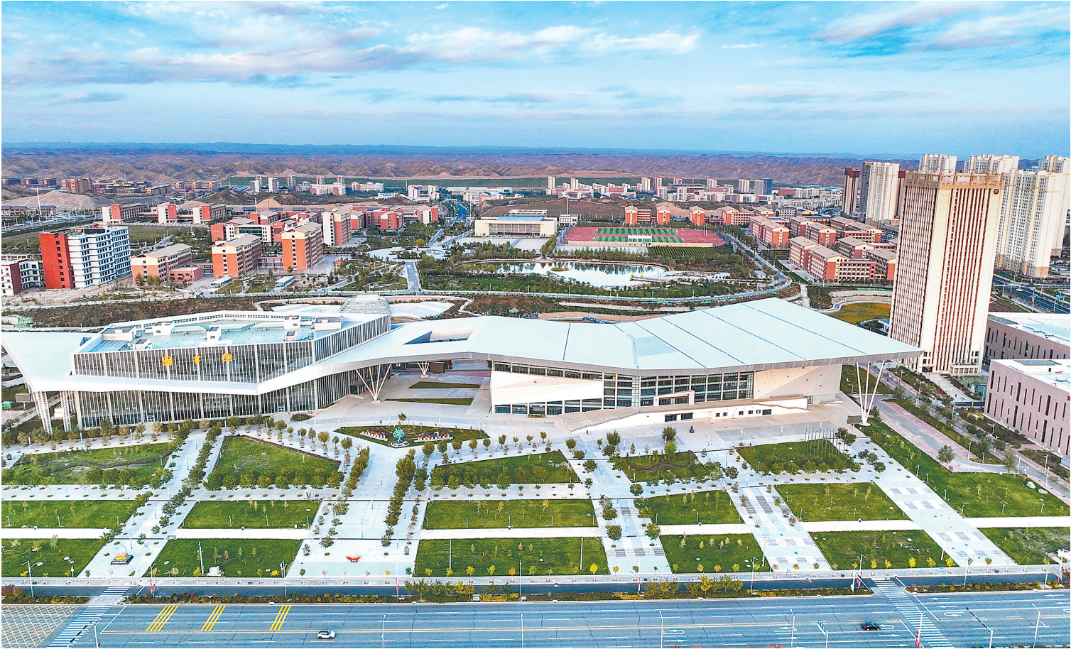
兰州新区职教园区。

我省坚持把发展卫生健康事业作为保障和改善民生的重要工作,卫生资源拥有量不断增加,医疗卫生服务能力不断加强,人民健康水平稳步提升。目前,全省共有医疗卫生