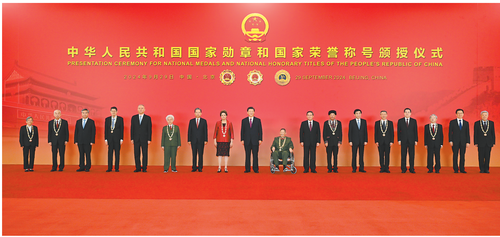
9月29日,中华人民共和国国家勋章和国家荣誉称号颁授仪式在北京人民大会堂金色大厅隆重举行。习近平等领导同志同国家勋章和国家荣誉称号获得者合影留念。

新华社北京9月29日电 中华人民共和国国家勋章和国家荣誉称号颁授仪式29日上午在北京人民大会堂金色大厅隆重举行。中共中央总书记、国家主席、中央军委主席习近平向国家勋章和国家荣誉称号获得者颁授勋章奖章并发表重要讲话。习近平强调,伟大时代呼唤英雄,造就英雄。英雄辈出,党和人民事业就会兴旺发达、长盛不衰。各级党委和政