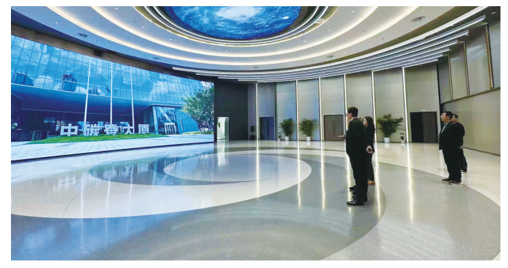
兴业银行兰州分行工作人员在武汉中融登交流。

3户主要省属平台企业的债券投资力度。另一方面,积极开拓对市级平台企业债券投资力度,助力定西市属融资平台债券直接融资。如今,兴业银行兰州分行已成为省内首家完成兰州城投美元债续期发行的金融机构,省内最大量续作兰州轨道交通企业债的机构和省内唯一投资定西市属融资平台的股份。