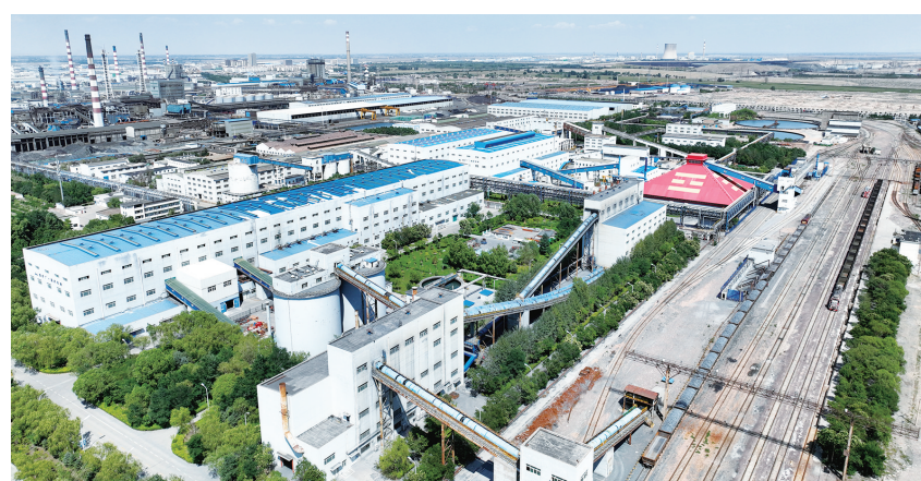
兴业银行信贷支持的金川公司。

着眼全局,做强债券。债券是投资银行主流业务,也是兴业银行兰州分行的重点业务之一。近3年来,兰州分行先后完成金川集团100亿元中期票据及40亿元超短期融资券、甘肃铁投集团50亿元权益出资票据及40亿元中期票据、甘肃金控集团15亿元超短期融资券及15亿元中期票据、甘肃农垦集团30亿元中期票据、甘肃能化集团10亿元中期票据、甘肃机场集团10亿元中期票据等债券的牵头注册工作,注册项下各发行主体累计实现