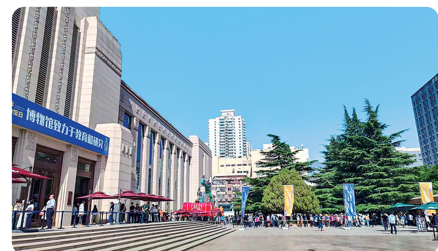
甘肃省博物馆人气火热,参观者络绎不绝。