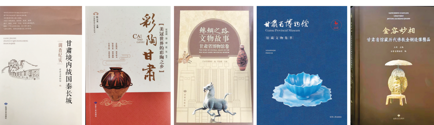
编著出版多部学术专著。

文物背后承载的人物和故事,探索原委、厘清细节,为文物保护利用工作奠定坚实的理论基础,为打造国家文化地标和中华民族精神标识提供实证依据。近年来,申报实施省部级以上课题46项,已完结31项,专业技术人员出版专著、馆藏文物图录、论文集等50余部,在国内外学术期刊上发表