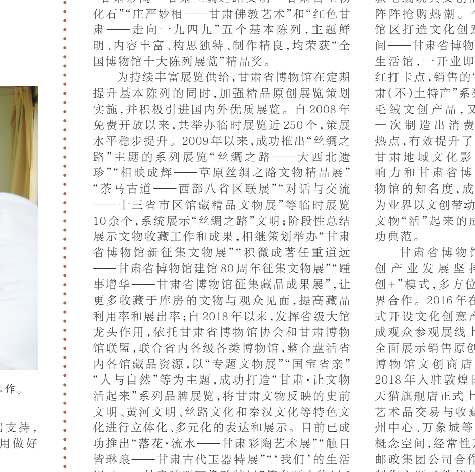
2024年6月,甘肃省博物馆艺术馆生活馆开业,打造集展览、书店、餐饮和文创多元业态分布的文化创意复合空间。

品大赛、文化创意产品推介活动中斩获多项。2022年,“马踏飞燕”文创玩偶爆火出圈,被评评为年度文博行业十大热点事件,近百家媒体先后进行专题报道,一跃成为文创“顶流”。甘肃省博物馆积极响应,紧跟“绿马奔奔”卡通IP形象,开展“绿马奔奔”文创产品开发,推出了一系列文创产品,如“绿马奔奔”毛绒玩具、文创笔记本、文创帆布袋等,深受游客喜爱,成为博物馆文创的热门产品。