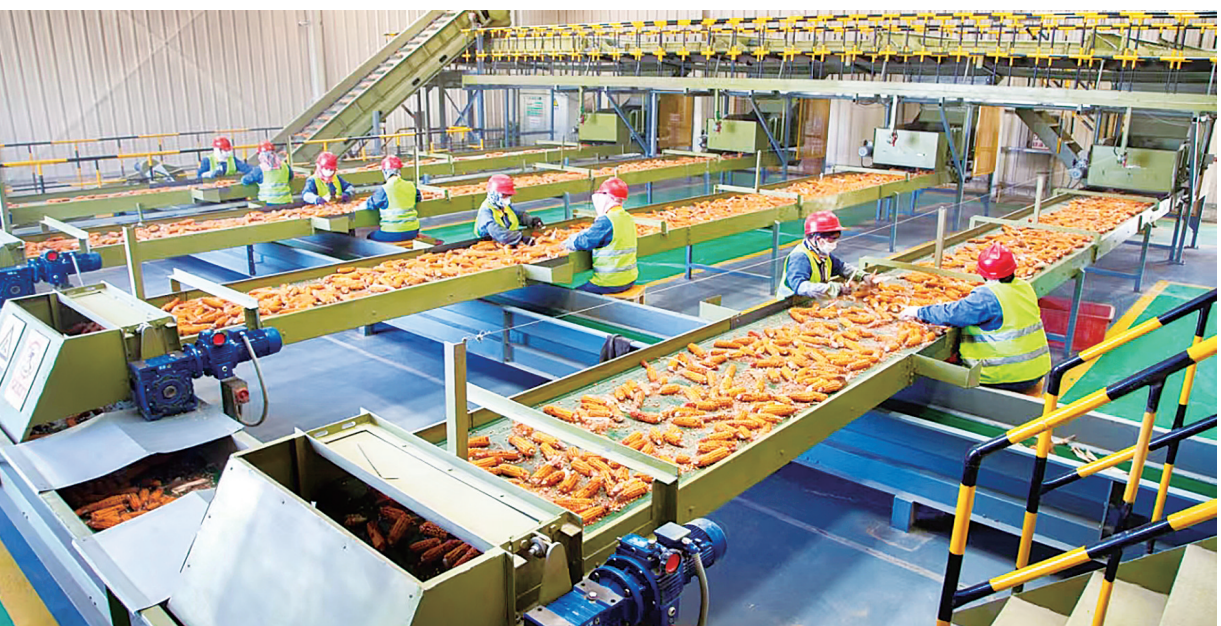
临泽县持续推进种业高质量发展。

“我们立足全市资源禀赋优势和产业发展基础,聚焦生产性服务业、生活性服务业、高成长性新兴服务业等行业细分领域,谋划储备重点招商引资项目100余项,为精准招商提供有效指引。围绕全市重点产业领域补链延链强链,通过多元化招商方式,聚焦目标企业靶向发力,大力开展对接洽谈。”张掖市招商局有关负责人表示。