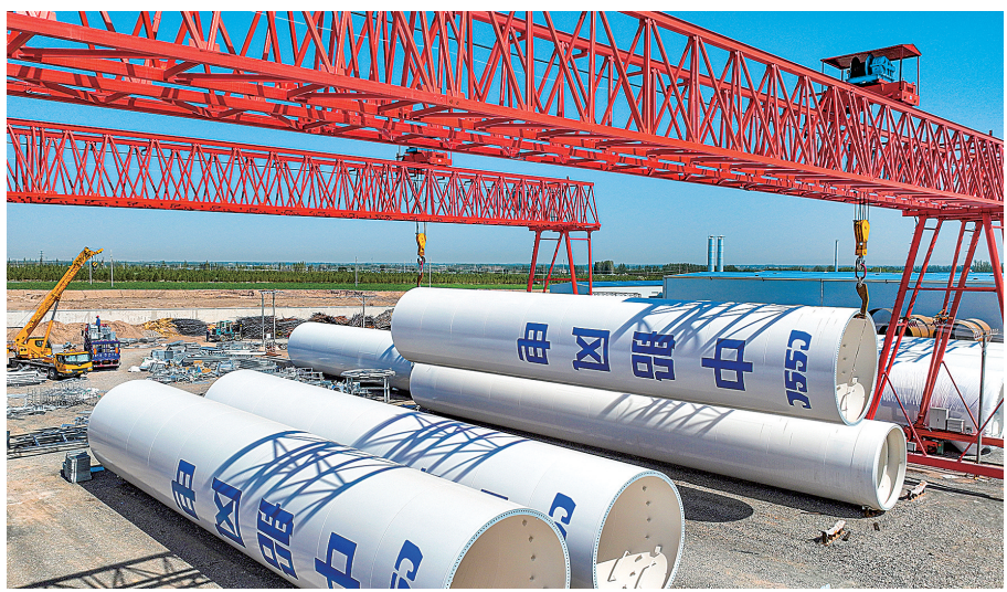
位于高台县的甘肃创腾电力装备有限责任公司风电叶片塔筒生产基地。 殷旭

据了解,张掖全市现有玉米制种企业90家,玉米制种种植面积稳定在100万亩以上。一家家种业公司的建设将为张掖