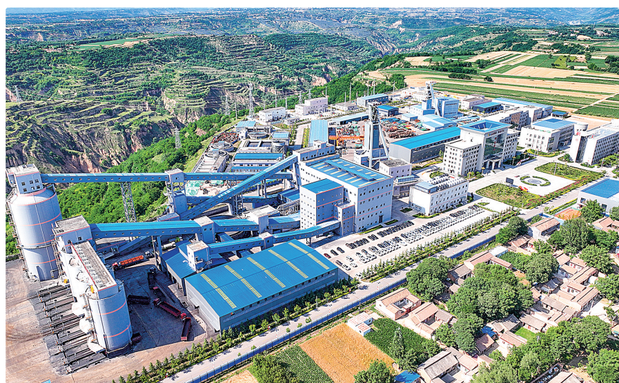
灵台邵寨煤矿。贾源

高效利用为引领,绿色建材、农产品加工、新能源产业梯次跟进的工业发展格局,经济发展动能日益强劲。