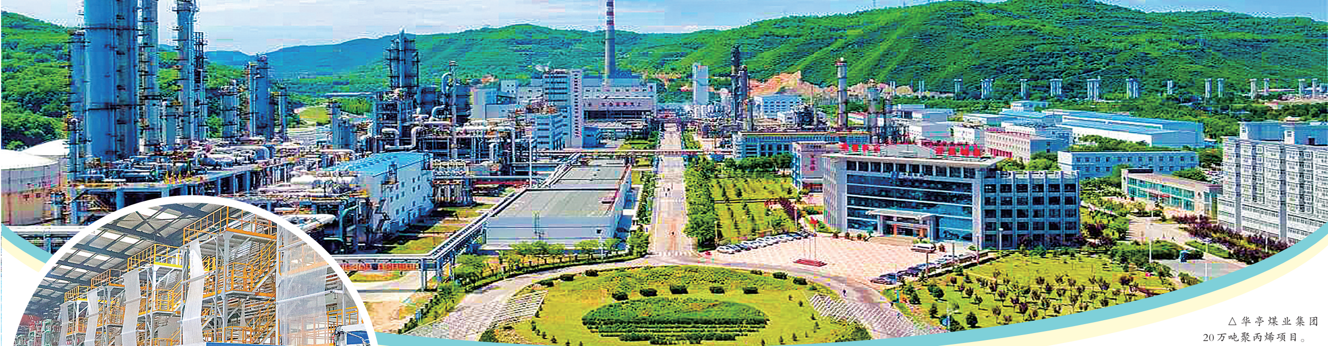
△华亭煤业集团 20万吨聚丙烯项目。