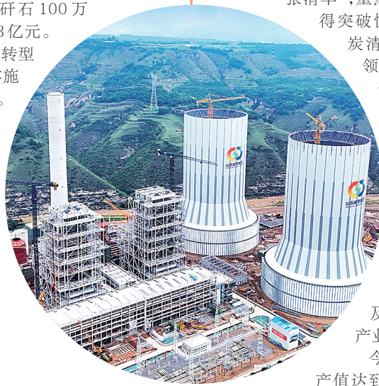
建设中的灵台电厂。马文军

今年,华煤集团以转型发展牵引全局,大力实施煤炭主业扩能升级。上半年,煤炭产量同比增加25.8万吨,甲醇产量同比增加1.25万吨,为全年生产经营取得新突破奠定了坚实基础。