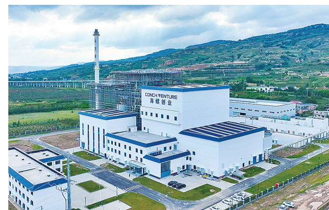
庄浪县生活垃圾焚烧发电项目。

转型发展的号角全面吹响,展望未来,平凉市工业发展前景广阔。平凉市将紧紧围绕打造全省工业转型发展创新区这一目标,深入推进强工业行动,加快煤电、建材、装备制造、农副产品加工等传统产业升级,培育壮大生物制造、新能源新材料等战略性新兴产业,前瞻布局低空经济、氢能、未来信息等产业,在优化产业结构、强化科技创新、推动技术改造、实施招大引强、培育经营主体、促进数实融合、实现绿色发展等方面聚力攻坚,为经济社会高质量发展增添更强后劲。