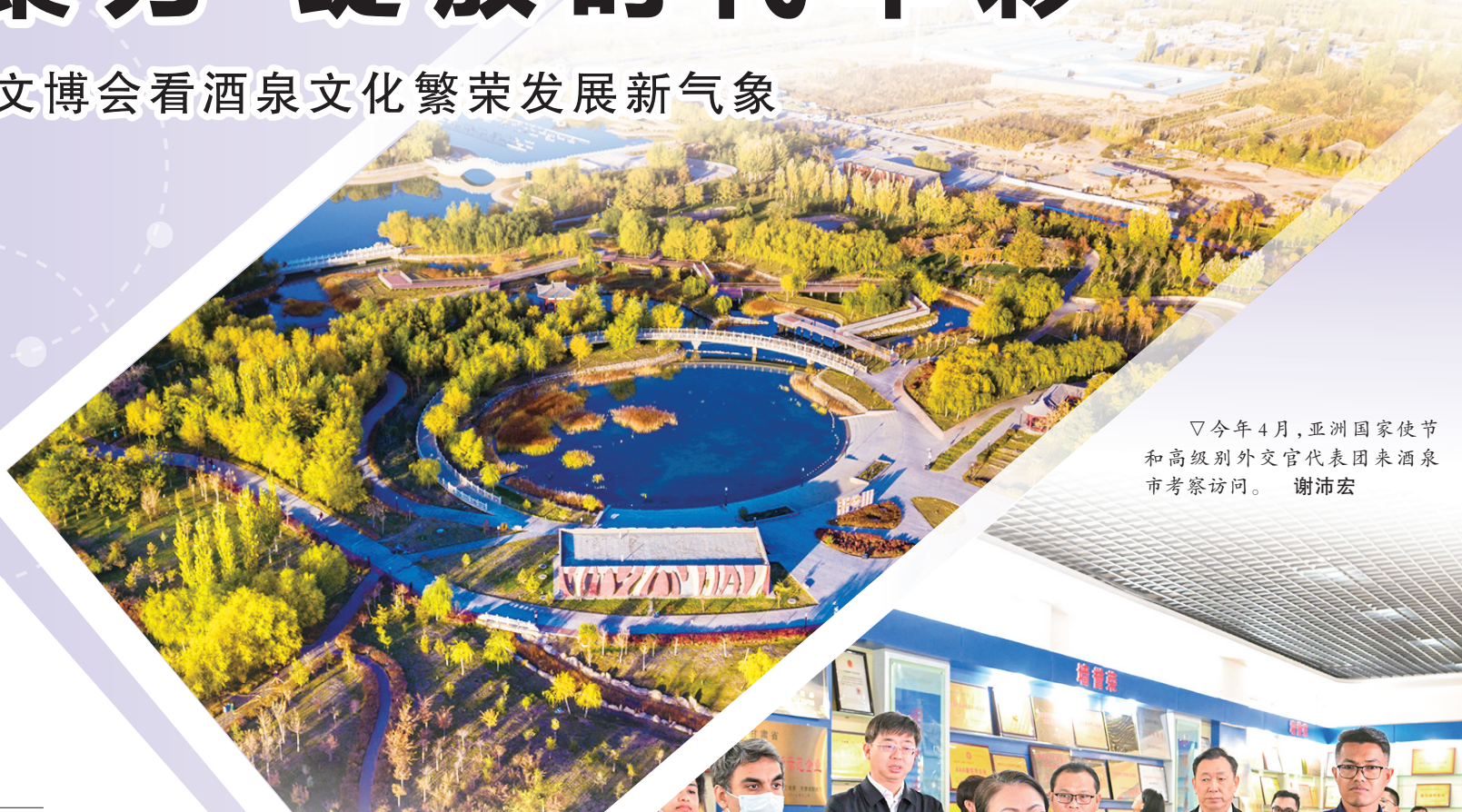
敦煌飞天公园。王斌银