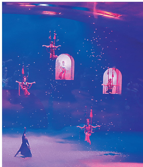
大型沙漠实景剧《敦煌盛典》演出现场。张晓亮

“敦煌做大做强会展产业，强化敦煌文博会展品牌运营，盘活‘三大场馆’资源，2023年引进举办各类会议、展览、节庆赛事、研学活动等359场次，吸引了16万余人参加。打造了敦煌夜市中亚风情街、上元市集、党河风情线等城市地标，将敦煌文化艺术元素融入城市建设，解码文化自信的城市样本，打开了‘人类敦煌 心向往之’城市品牌标识。”敦煌市委主要负责人表示。