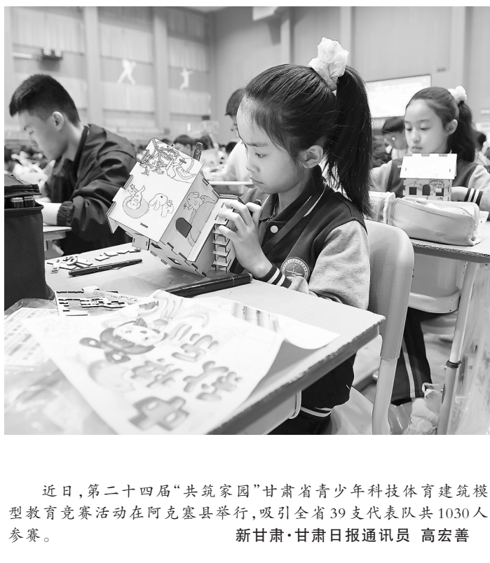
近日,第二十四届“共筑家园”甘肃省青少年科技体育建筑模型教育竞赛活动在阿克塞县举行,吸引全省39支代表队共1030人参赛。