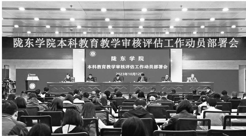
陇东学院本科教育教学审核评估工作动员部署会。

展、产业结构调整和技术进步、创新驱动对人才的需求,聚焦建设西部高水平应用型大学的办学定位,按照“总量控制、结构优化、转型驱动、特色发展”原则,通过理顺学科归属,改造传统专业,整合相近专业。2022年以来撤销10个本科专业,停止招生18个本科专业,增设急需专业,推进多学科专业交叉融合,激发专业建设内生动力。紧紧围绕庆阳市“五区一中心”发展定位,实现专业集群和产业链、创新链、人才链的精准主动对接。瞄准能源化工、装备制造、旱作农业、信息技术、生态环境等重大产业领域,拓展“四新”专业方向与改造传统专业,积极培植“机器人工程”“数字经济”“人工智能”“智慧农业”“新能源科学与工程”等新的专业方向,形成服务“五区一中心”发展定位的“能源化工、信息技术、教师教育、农林生物、社会服务”五大专业集群。