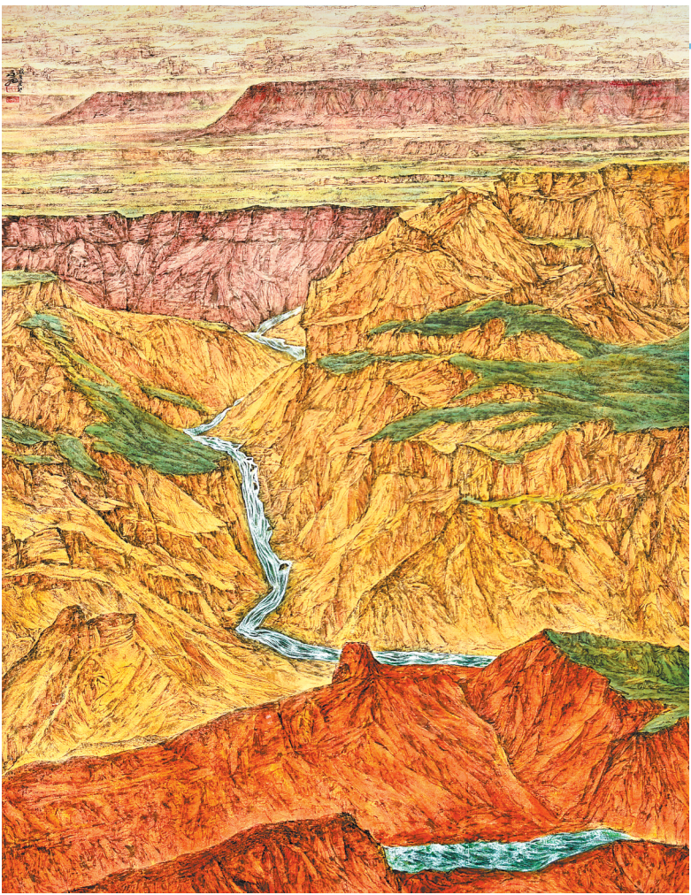
西部·西部 (中国画) 何永飞