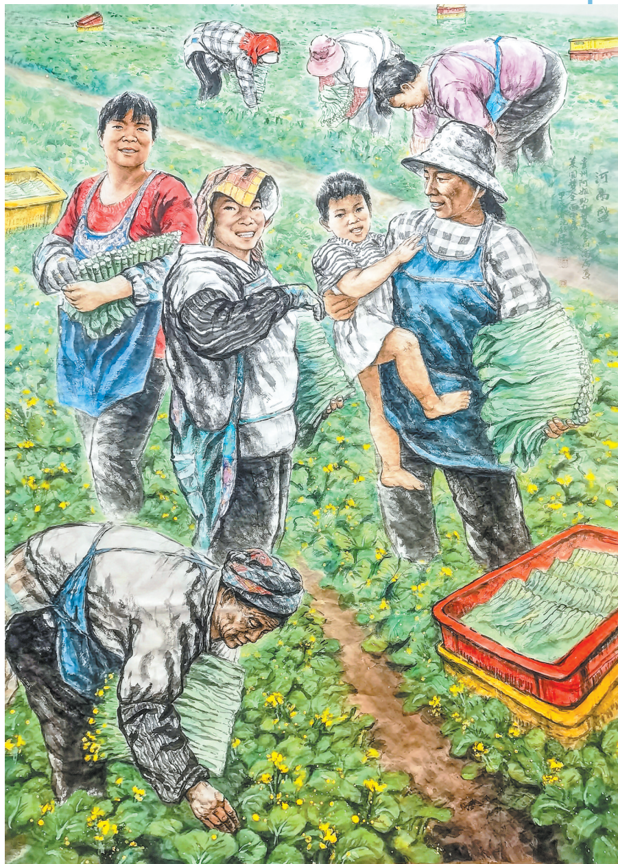
河西盛夏 (中国画) 王晓银