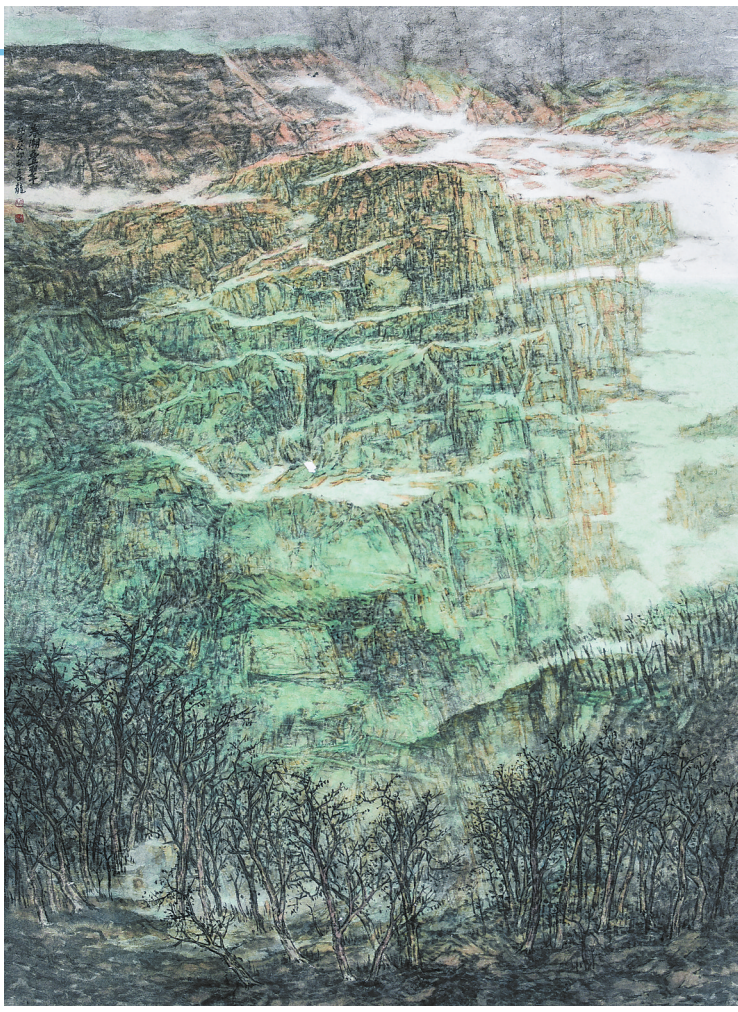
秦湖叠翠 (中国画) 南长龙