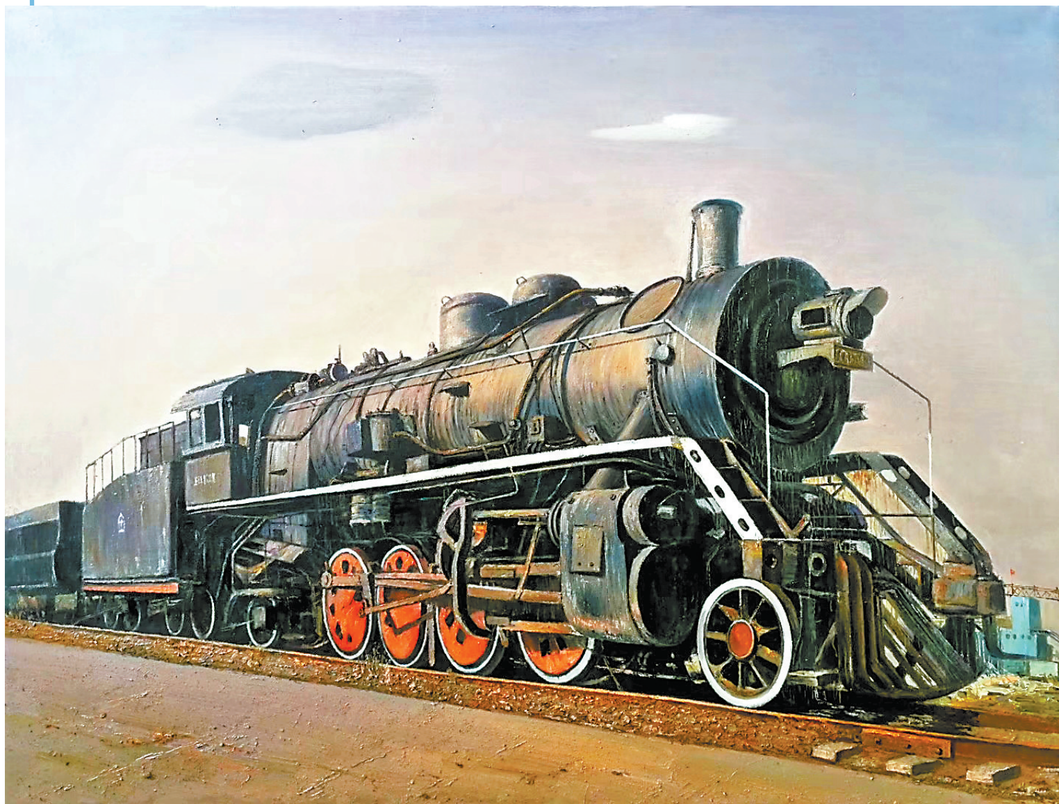
镍都的记忆——一九七一 (水彩画) 叶雷