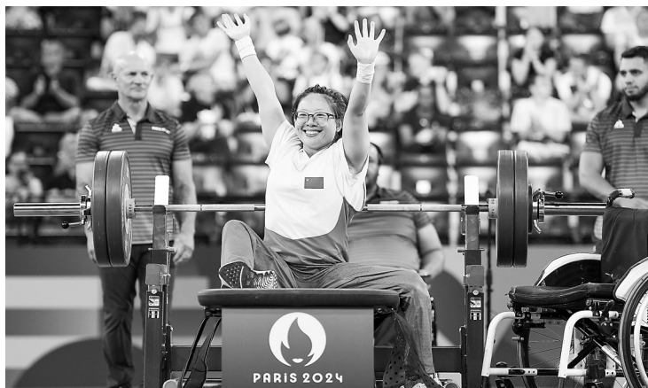
崔哲(前)在比赛后庆祝。9月4日,在巴黎残奥会举重女子41公斤级比赛中,中国选手崔哲以119公斤的成绩夺得冠军。