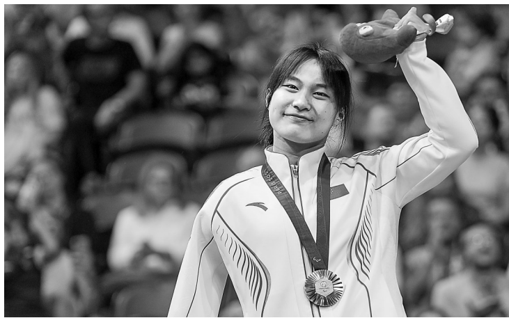
蒋裕燕在颁奖仪式上。9月4日,在巴黎残奥会游泳女子100米自由泳S7级决赛中,中国选手蒋裕燕打破世界纪录获得冠军。